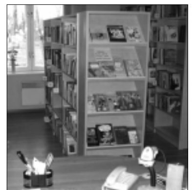
Vaade uue välimuse saanud raamatukoguruumi.