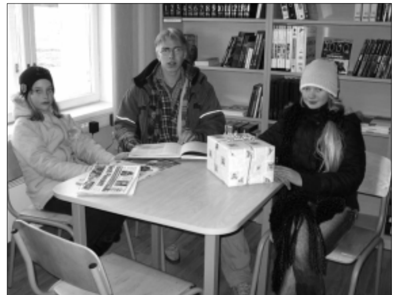
Noori lugejaid rõõmustab Saksi raamatukogu uuenduskuur.

Üheskoos jõuab rohkem. Täname kõiki, tänu kelle toetusele ja tööle on raamatukogu uue ilme