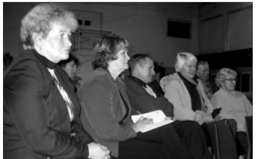
Lehtses oli vallavalitsusega kohtumas kümnekond huvilist.