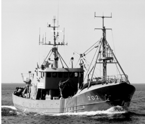
PVL-202: pikkus 40 m, laius 6,6 m, süvis 3 m, veeväljasurve 471 tonni.