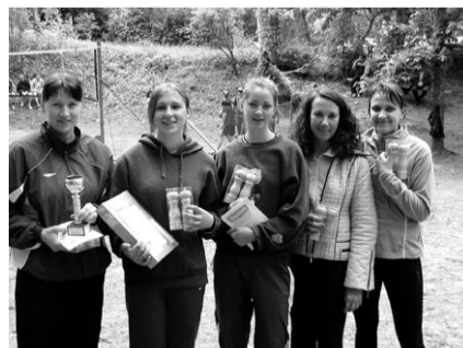
Naistest võitis Valmiera naiskond.