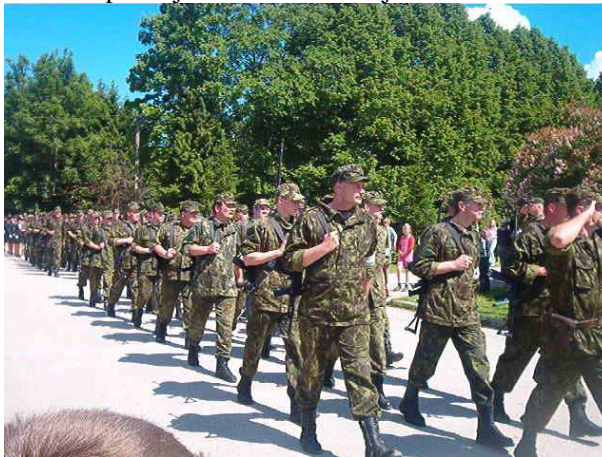
Kaitseliidu pidulik marss Kaius.