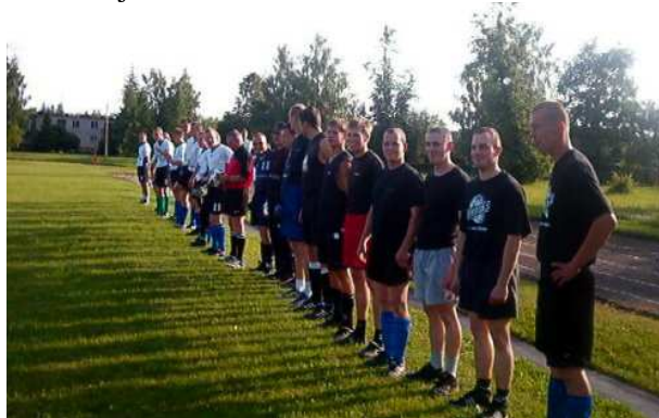
Jalgpallimeeskonnad kohtumise eel 2.juulil 2003.