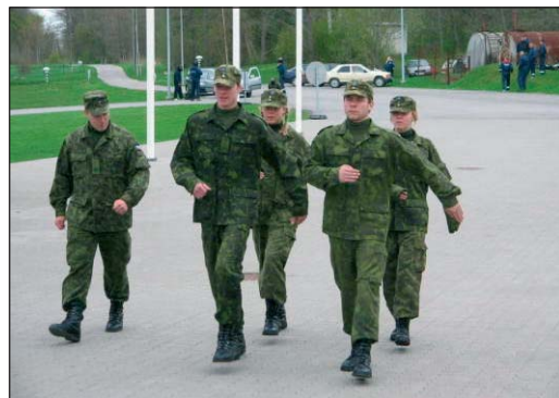
Vasak, parem...

23.-26. maini viibisid Tabasalu Ühisgümnaasiumi õpilased Muraste Piirivalvekoolis