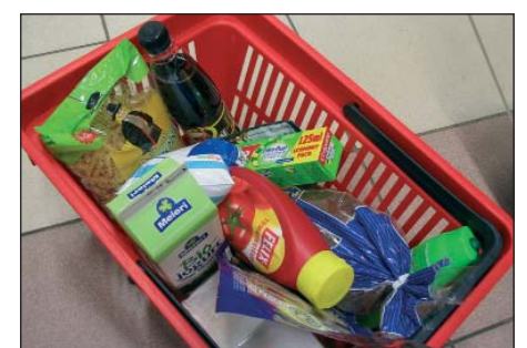
Kaupade pakendamine on muutunud järjest materjalimahukamaks.