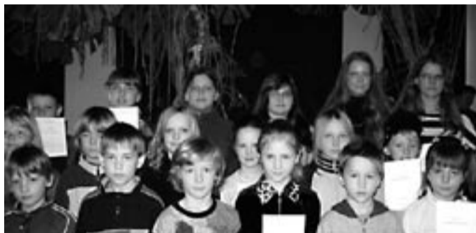
Keeni kooli viielised