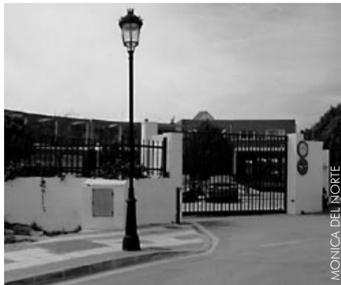
Kooliõue suletud väravad