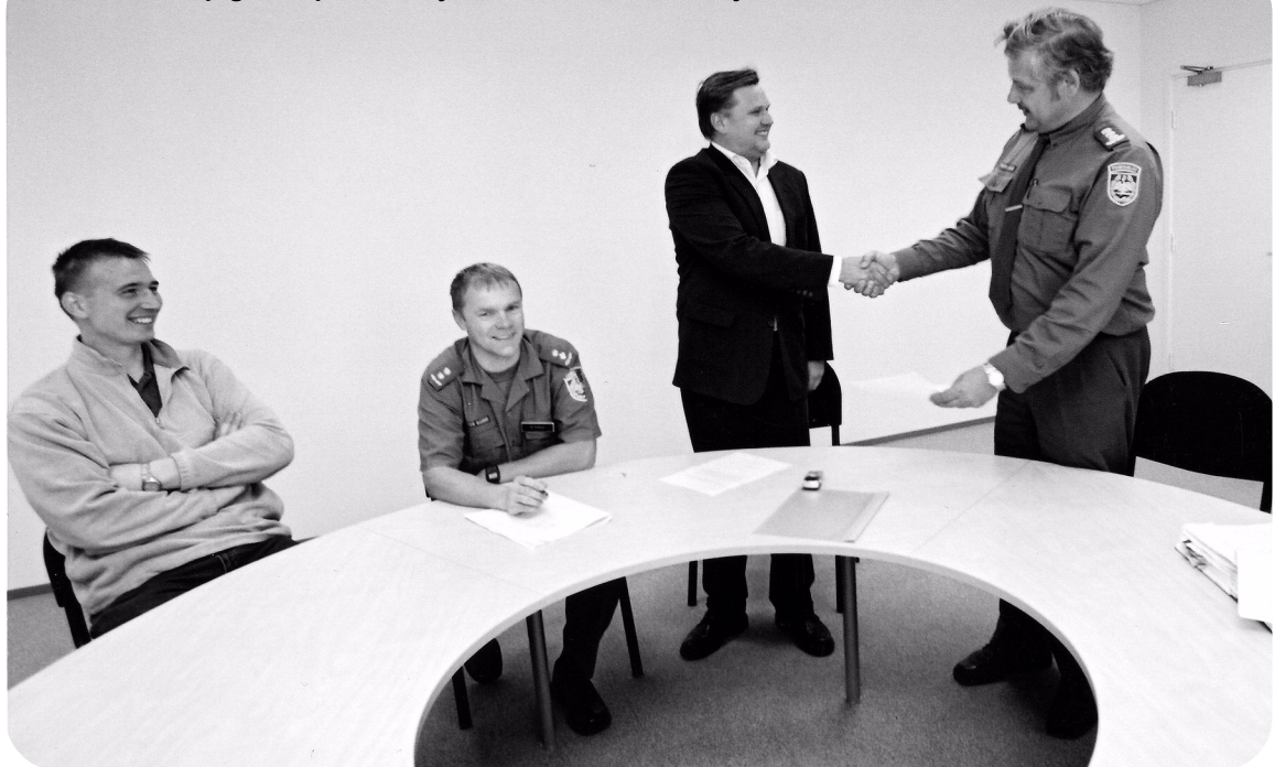
Sõbralik käepigistus pärast maja vastuvõtuaktile allairjutamist.

elamist mitmed probleemid – kord ei töötanud telefonid ja arvutid, siis ei tulnud ajalehed õigesse kohta, ühed ei saanud oma tubadesse sisse, teised sealt välja. Alguses oli tubades liiga palav, siis tuli jällegi külma