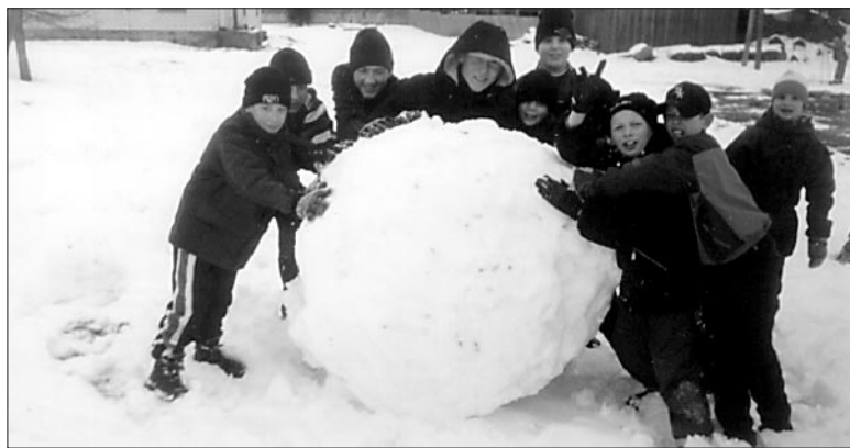
● Sudistes lastehommikul vormiti hiiglaslik lumepall.