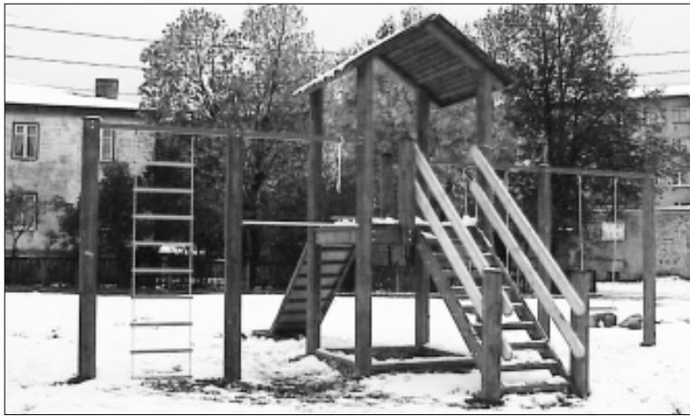
Õuna tänaval asuv uus mängumaja.