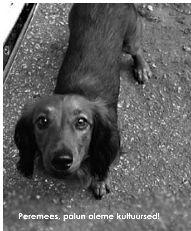
Peremees, palun oleme kultuursed!