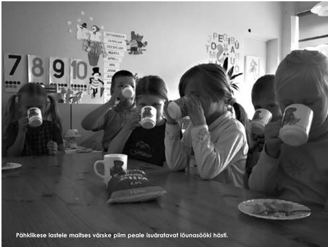
Pähklikese lastele maitses värskes piim peale isuäratavat lõunasööki hästi.

Siiani on riiklikus koolipiimaprogrammis osalenud meie valla koolide õpilased I-IV klassini ja saanud 2003/2004 õa riigilt iga päev klaasi tasuta piima või jogurtit või mõnd teist piimatoodet projektis lubatud toodete sortimendist.