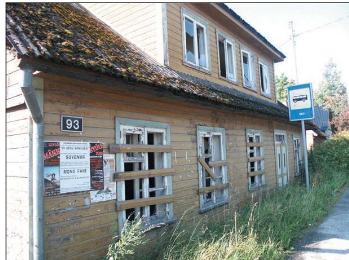
PILDIALLKIRJAD: ANTS PAJU

Need pole ainukesed räämas objektid linnas. Kauaks veel... ?