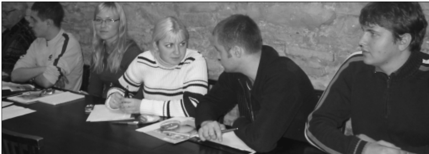
■ Tasemel loeng-see oli EPMÜ tudengitele nagu kingitus.