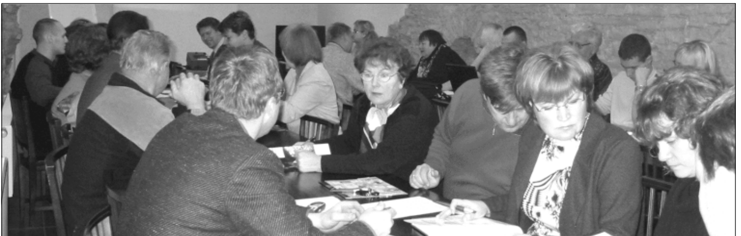
■ Seminarist võttis osa arvukalt maakondade veterinaare, kalahaiguste spetsialiste.