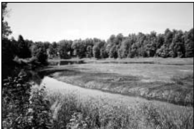
Äravoolanud paisjärv ja Vöhandu jõe säng.

Liigveelask (orel) koosneb 10-st 1,5 m läbimõõduga truubist. Toru pikkus on 10,56 m, alumise otsa telg on kõrgusel 34,94 m(abs). Ülaoatsa telg on kõrgusel 35,06 m (abs). Torude väljavoolud on ka suurvee ajal uoutamata. Vooluhulk on ainult ülaveetasemest.