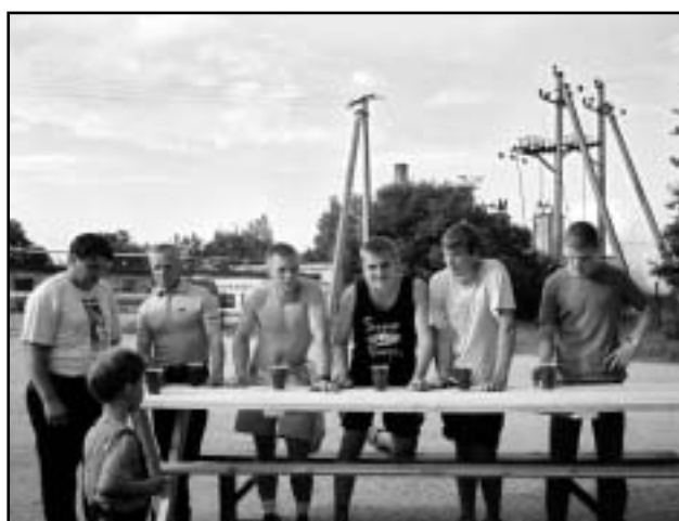
Rahumäe noored rammumehed.