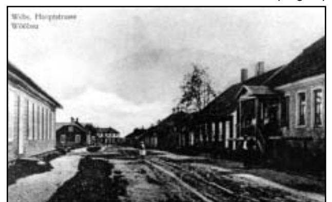
Võõpsu peatänav (Räpina maantee).