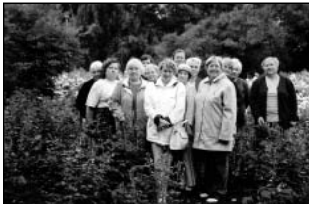
Röpina naised Põltsamaa Roosisaarel.