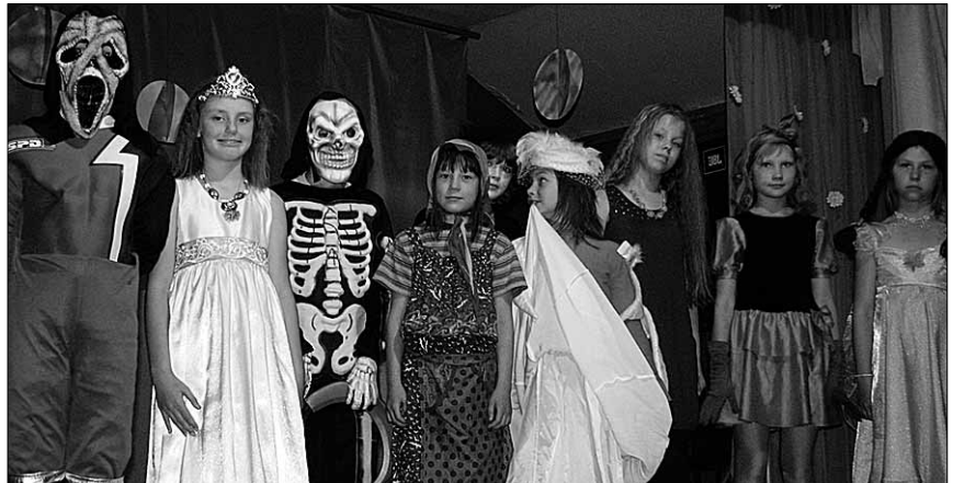
● 18. juunil oli Viiratsi lastelaagri lõpupidu.