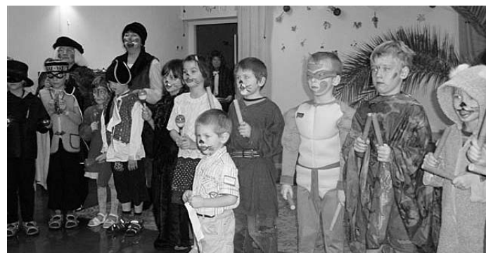
Mardikarneval. Vaata pilte lisaks lasteaia kodulehelt www.ambla.ee/lasteaed .