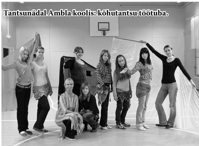
Tantsunädal Ambla koolis: kõhutantsu töötuba.