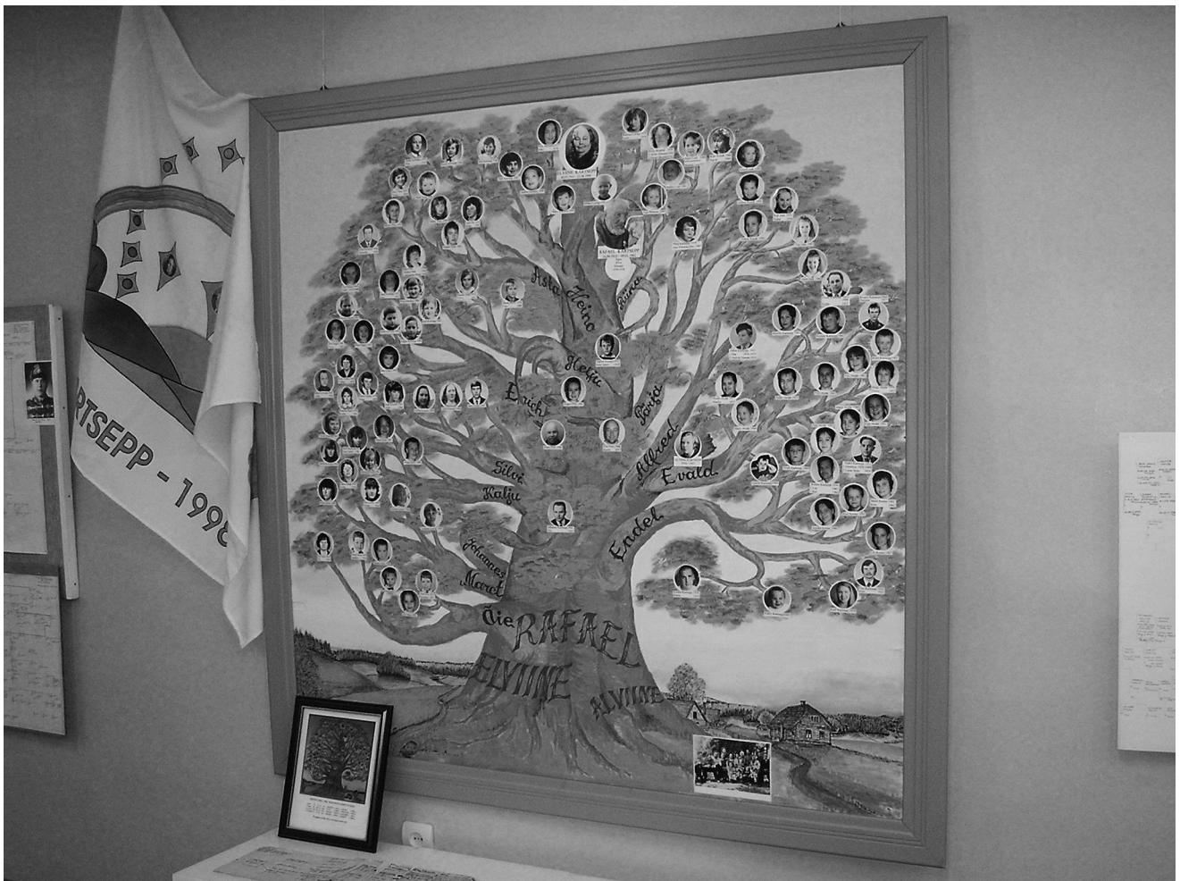
Kartsepp'a sugupuue EGeSi näitusel Võrumaa muuseumis

Soovin kõigile tegusat sugupuueuurimise suve eelkõige välitöödel (st sugulasi otsides ja leides), kuid miks mitte ka arhiivides dokumente uurides ja internetis surfates. Ärge unustage ennast seejuures aga päikeseenergiaga laadimast, et sügisel jälle tegusa seltsieluga edasi minna.