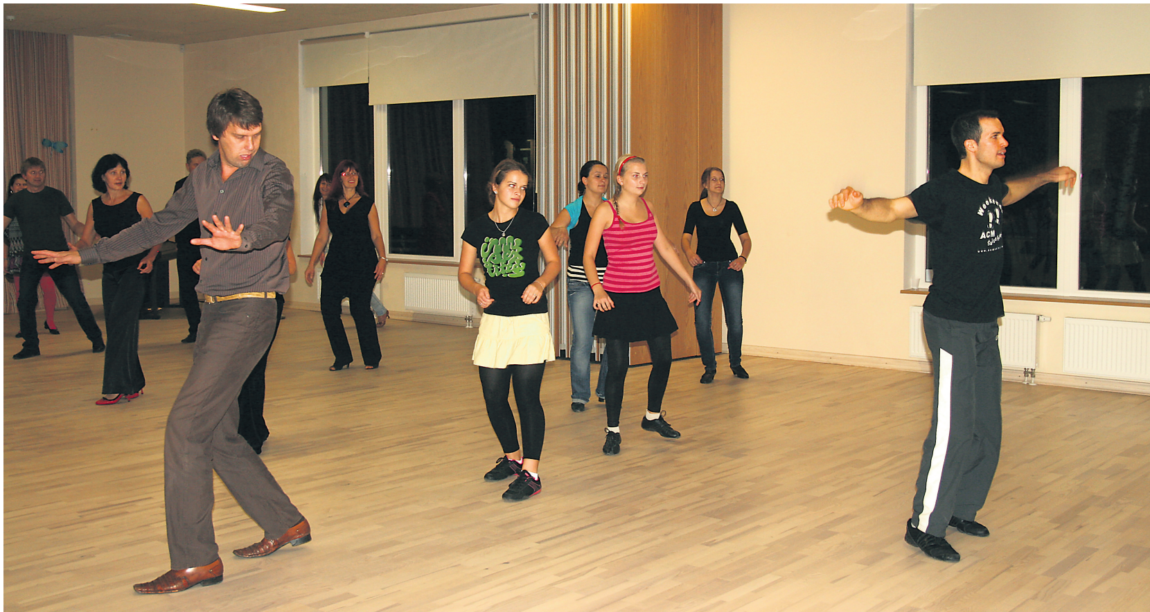
Et tantsusammud ja keha kuumade rütmide taktis harmooniliselt liikuma saada, tuli hoolega tantsuõpetajat jälgida.