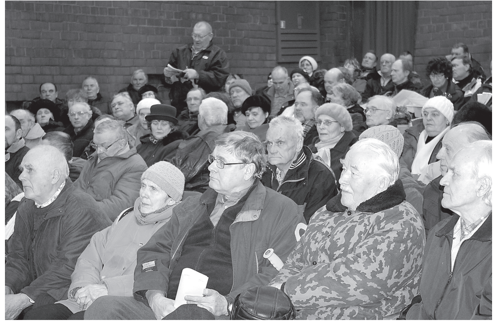
Esmaspäeval toimunud kohtumisel linnarahva, linnavalitsuse ja AS Veolia Keskkonnateenused esindajate vahel ei mahtunud rahvahulk linnavalitsuse saali ära ja seetõttu koliti koosolekut pidama Sinilindu. Nii suurt publikumenu Elvas nautis viimati ehk vaid Kihnu Virve.

On kasulik teada, et Eestis on müügil plastikkonteinerid, mille kvaliteet ei sobi Põhjamaa tingimustele. Need on rabadast pehmet plastikut, mis tühjendamisel purunevad ja selliste konteinerite eest prügifirma ei vastuta. Kaupmeestelt tuleks küsida, kas kontei-