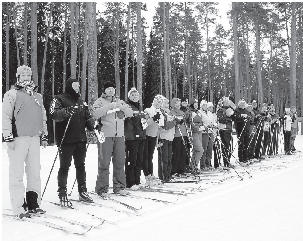
Õnneseene lasteaed rivistas stardijoonel üle kahekümne oma kollektiivi liikme ja toetajaliikme.