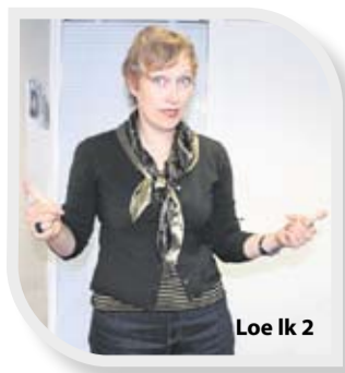
Loe lk 2

“Oma suurusega mõjutame me mitte ainult numbreid aruannetes, vaid sadade ja tuhandete töönimeste igapäevaelu ja tulevikuplaane.”