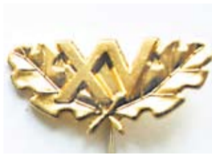
15 aastat tööstaaži