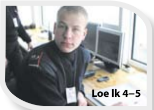
Loe lk 4-5