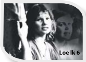
Loe lk 6