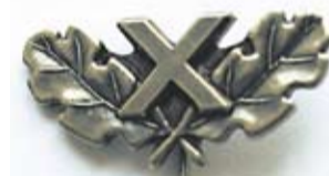
10 aastat tööstaaži