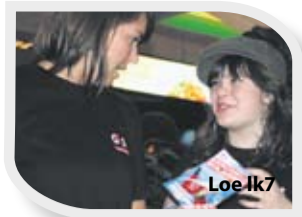
Loe lk 7