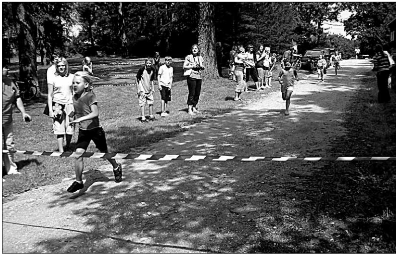
● Laste üheks osavõturohkemaks alaks Uue-Karistes külade spordipäeval oli pargijooks.