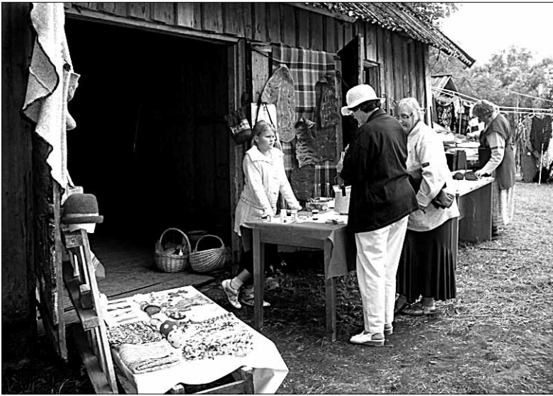
• Vanu traditsioone taaselustasid Rimmu külapäeval põnevad etnohõngulised õpitoad.