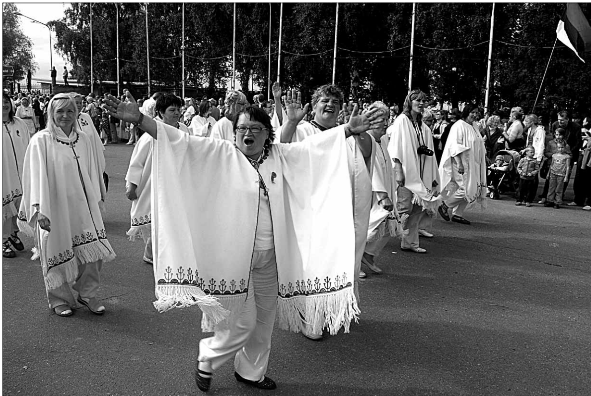
● Abja kultuurimaja segakoori Kaja lauljad meeleolukas laulupeorongkäigus.