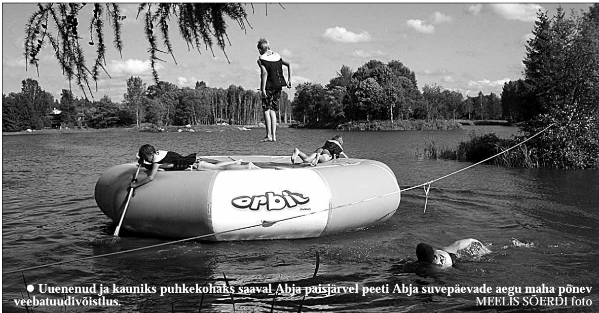
Uuenenud ja kauniks puhkekohaks saaval Abja paisjärvel peeti Abja suvepäevade aegu maha põnev veebataudivõistlus.

Vallavanem tänas ühtlasi perekond Laarmanni, kes kaasomanikuna on