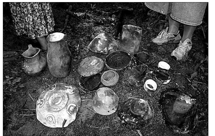
Niisugune näeb välja pildil tagaplaanil olevast põletusaugust just välja võetud keraamika.

“Õpetasin laagrilistele kirivöö tegemist võõtelgedel ehk -raamidil ja lõngategu. Laupäeval lammast tuli kui staar autoga Paudile kohale. Algas lambapügamine. Iga huviline sai seda tööd lambaraudadega proovida. Pügatud villa pesime villašampooniga puhtaks, loputasime kolm korda läbi ja kuivatasime. Pärast järgnenud villatopsude ja prahi väljanäppimist ja villa käsikraasidega kraasimist valmis sellest voki kdrates ilus valge lõng.” (Järg 6. lk)