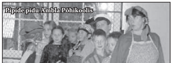
Pipide pidu Ambla Põhikoolis