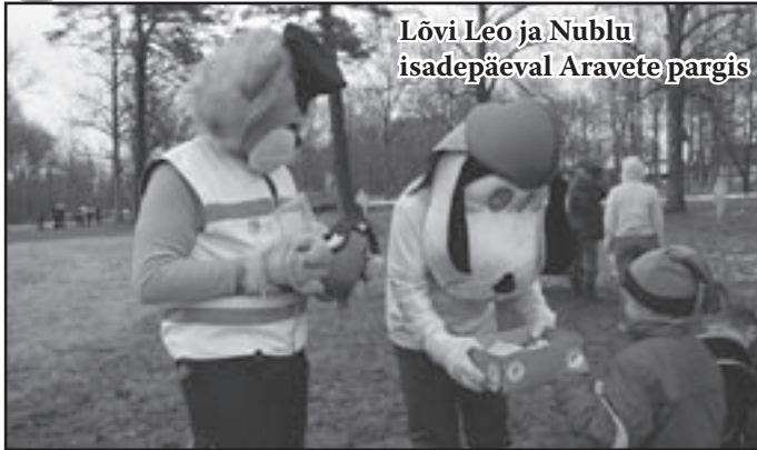
Lövi Leo ja Nublu isadepäeval Aravete pargis