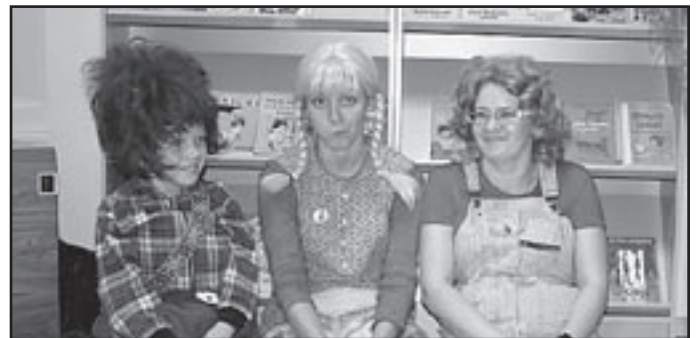
„Väike väänik, anna asu ...“ Riiviltel A. Lindgreni teoste väljapanek.

Kontserdil „Kutse sünnipäevale“ kõlavad isamaalised ja advendilaulud.