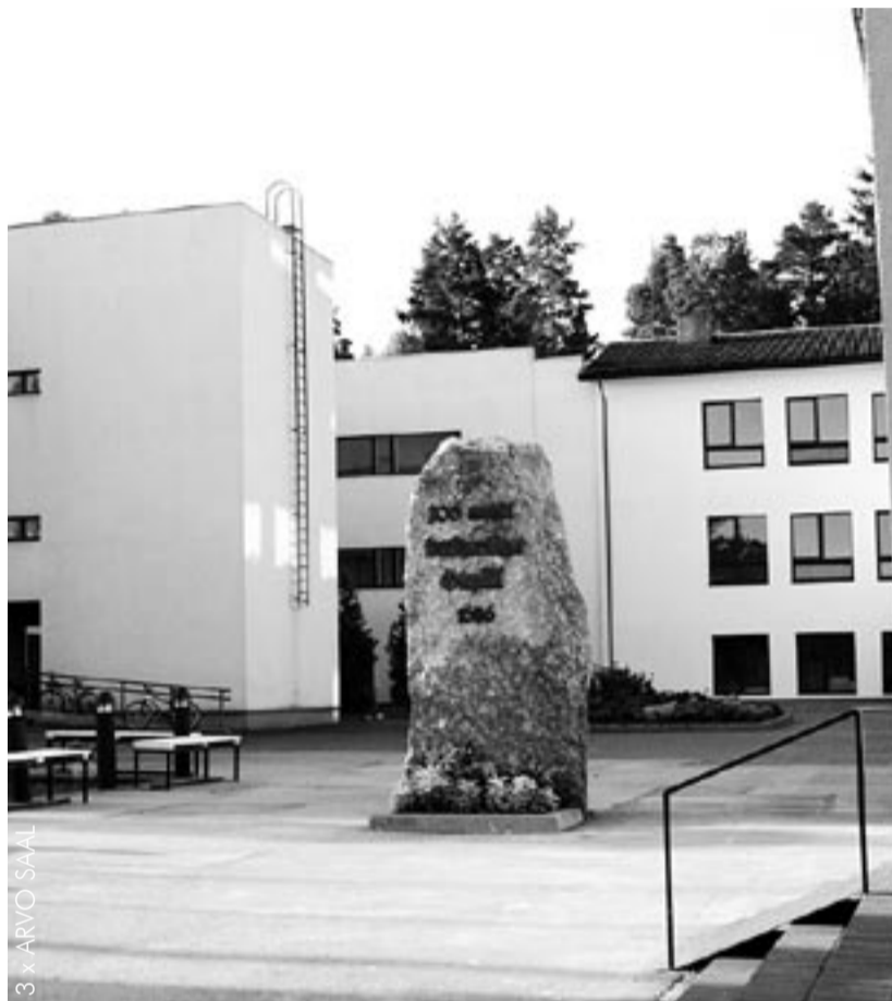
Otepää gümnaasium on juubelitepo külaliste ootel.

Meenutame, et viimase seal kasvanud 100aastase puu murdis 2005. aasta 9. jaanuari torm. Samas avatakse ka mälestustahvel.