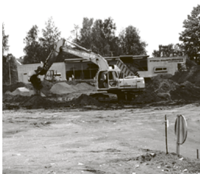
Otepää kesklinnas algasid Maxima kaupluse ehitustööd. Uuel poel peaks tulema müügipinda üle 700 m 2 .

Kogunemine Audentese kooli juures. Tel. 5094 421