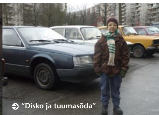
⇒ "Disko ja tuumasõda"