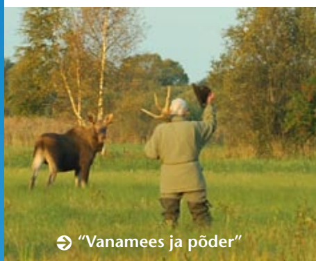
⇒ "Vanamees ja põder"