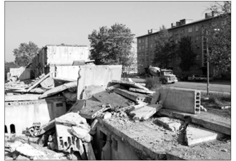
Скоро от долгостроя Вахгейе останутся только воспоминания.

По словам заместителя волостного старейшины Теэта Койгьярва полуразрушенное здание без оградительного забора представляло опасность. Дети и молодежь из окрестных домов превратили недостроенное здание в место сбора развлечений. «Несчаст-