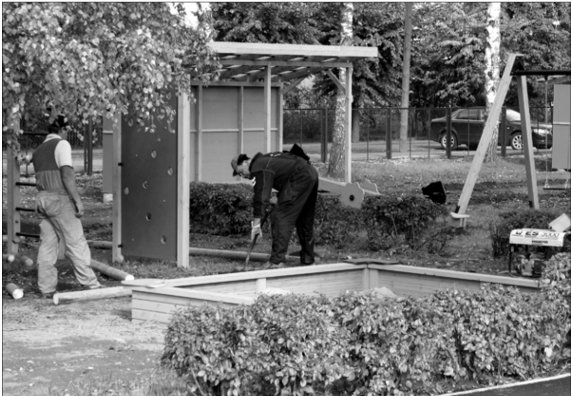
Рабочие возводят детскую игровую площадку при детском саду «Писипынь».