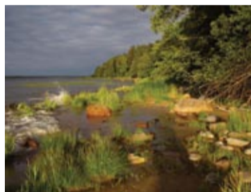
Henrik Lepp - III koht lapsed.