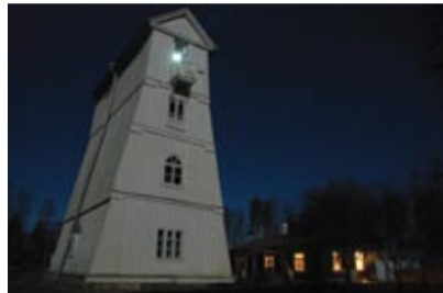
Merle Hirvlaan - III koht täiskasvanud.