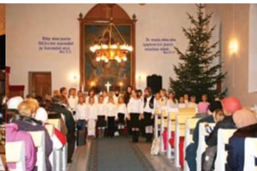
Kontsert Rannamõisa kirikus.