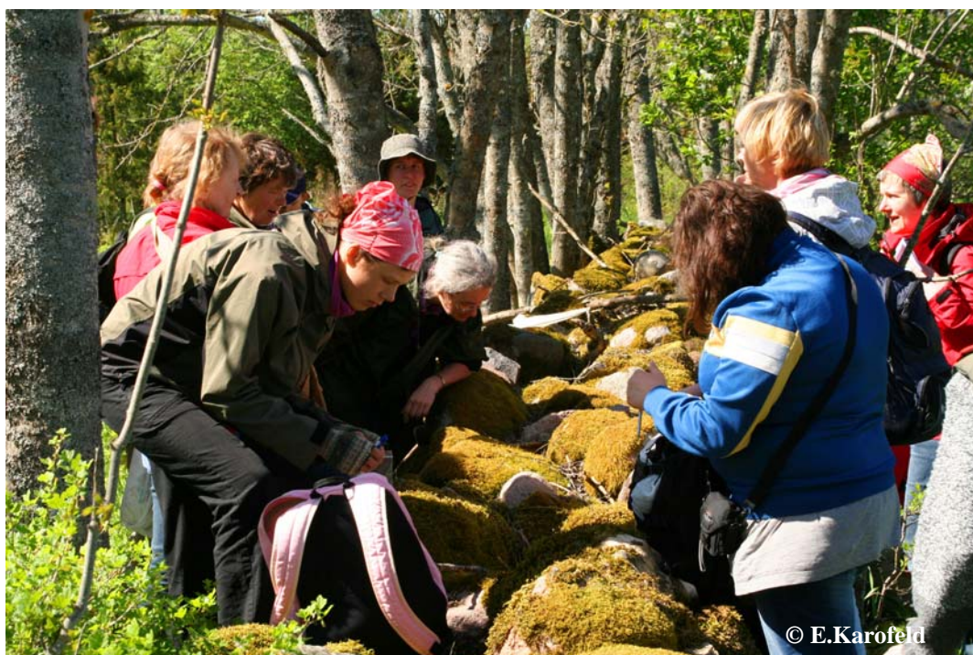
Foto 2. Esimene peatus, esimene tutvus – vana kiviaed on kaetud paasmeelikuga. First stop, first introduction – old stone fence covered by Homalothecium sericeum.

Usinamad looduseuurijad jõudsid aga siiski märgata ja tähelepanu juhtida ka Kesselaiu huvitavamatele kaitsealustele soontaimedele. Nii sai tutvust tehtud ka