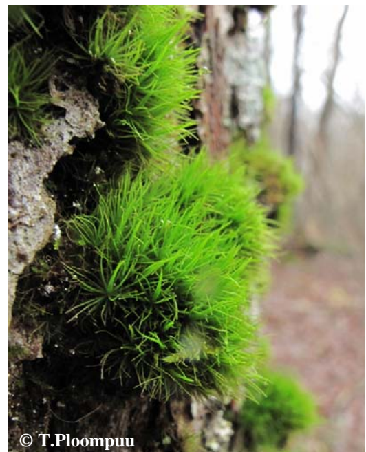
Foto. Rohelise kaksikhamba tutid tamme tüvel.

juurde peale koosluse täpsema paikapanemise.