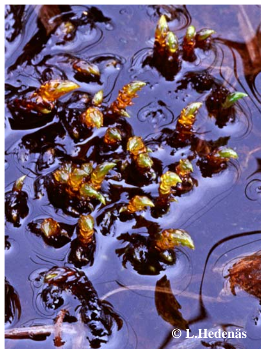
Foto. Nii suuruselt kui ka morfoloogiliste tunnuste poolest erinevad tavasirbik ( S. cossonii , vasakul) ja harilik skorpionsammal ( S. scorpioides ) on molekulaarsete tunnuste poolest lähisugulased.

Morphologically different species S. cossonii (on left) and S. scorpioides are close relatives according to the molecular data.