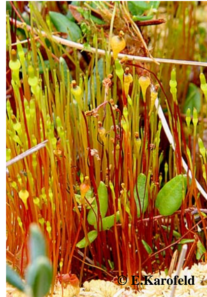
Foto. Pudelpõisiku eoskupraid Kõnnu-Suursoos, august 2010.

peale pudelpõisiku veel punane põisik ( S. rubrum ), anum-põisik ( S. vasculosum ) ja kerajas põisik ( S. sphaericum ). Viimased kolm liiki on arvatud Eesti Punasesse Raamatusse (2008).