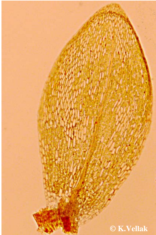
Meri-pungssamblal on iseloomulik nõgus ümaratipuline leht.

Bryum marratii has convex leaves with blunt apex.