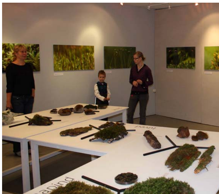
Nurgake samblanäituselt. One part of the exhibition.