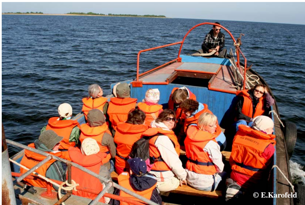
Foto 1. Turvaline teekond Kesselaiule erepunastes päästevestides. It was safe to sail to Islet Kessleaid in red life jackets.