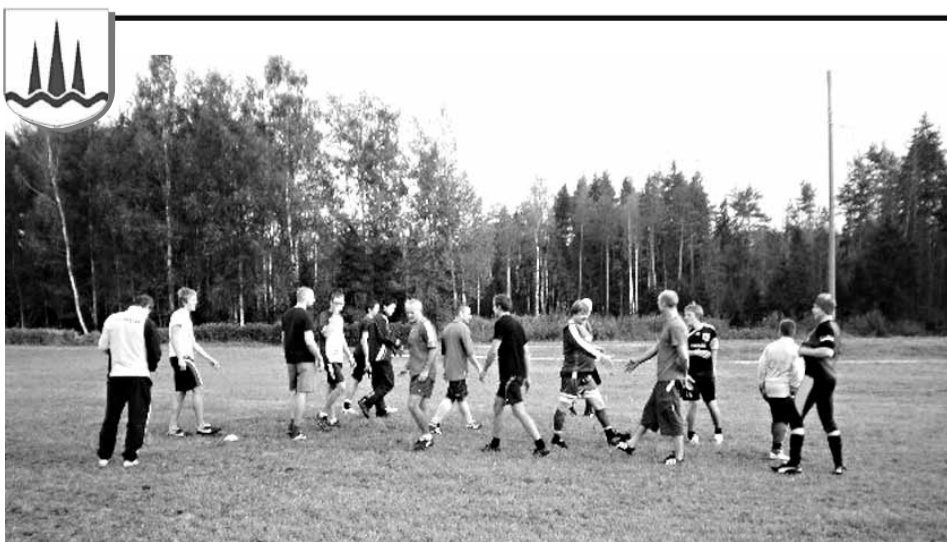
Palupera valla külade jalgpalliturniir Räbi külas