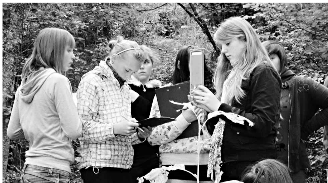
Pühajärve kooli matk

See oli väga meeldejääv ja õpetlik päev nii lastele, õpetajatele kui ka matkal kaasas olnud lapsevanematele.