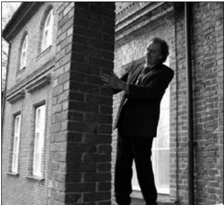
60-aastane nostalgiline koolipoiss oma 45 aastat tagasi sissekraabitud nime koolimaja tellisepostilt otsimas.