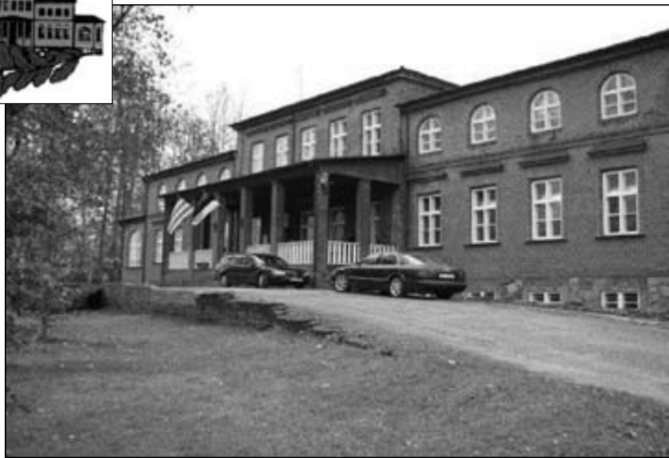
Tihemetsa Põhikool 2007. a. sügisel.

27.oktoobril tähistas Tihemetsa Põhikool (endine Väljaküla kool) oma 230. aastapäeva. Rohkem kui seitse inimpõlve on siinmail rahvale haridust antud. Läbi aegade on kool olnud nii kaheklassiline (1902. a. Voltveti 2-klassiline Ministeriumikool) kui ka peaaegu keskkool (1945. a. Väljaküla Mittetäielik Keskkool).