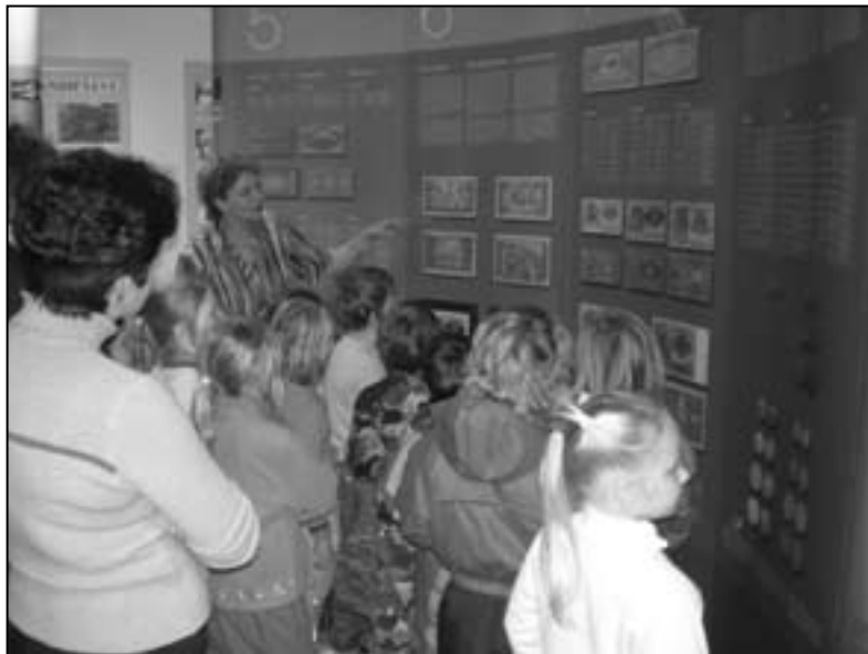
Lapsed huviga kuulamas Eesti raha ajalugu.

Muuseumis sai iga külastaja kaasa infovoldikuid ja brošüüre ning lasteaiale kingiti 4 puzzlet erinevatest rahadest, mida pärast lõunauinakut usinalt kok-