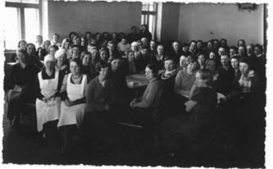
Toiduvalmistamise kursus Saarde Majanduse Ühisuse saalis.