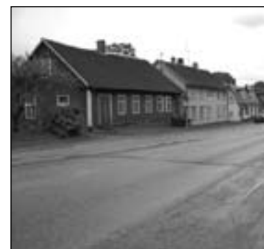
Pärnu tänav aastal 2006.