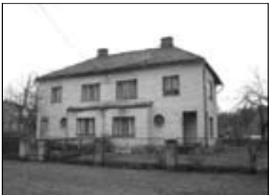
Paarismaja Kiriku 7/9