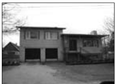
Järve põik 6

Lisaks individuaalelamutele töi nõukogudeaeg kaasa ka korterelamute ehitamise. Üksikuid korterelamuid oli ka iseseisvusaegses linnas, kuid hoonete koguarvuga võrreldes oli tegemist siiski erandiga. Esimene pärast sõda püstitatud korterelamu on tõenäoliselt metsakombinaadi