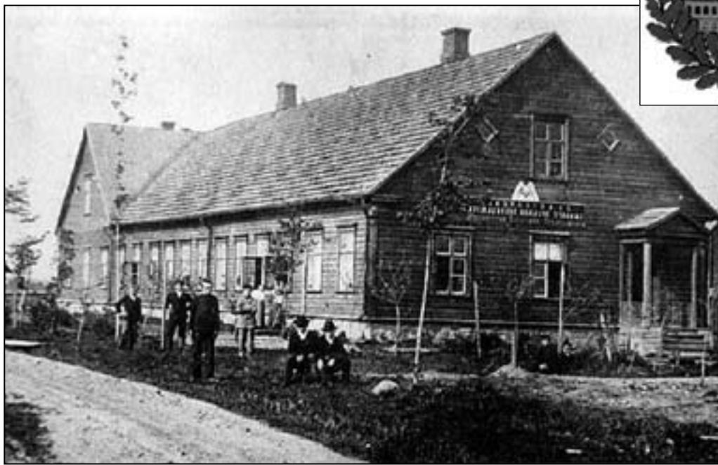
Voltveti 2-klassiline Ministeriumikool.