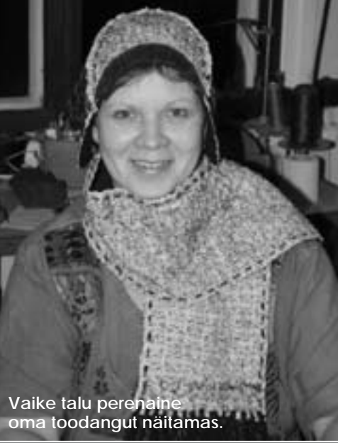
Vaike talu perenaine oma toodangut näitamas.