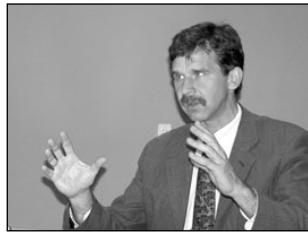
Ümarlauas arutati tänavakultuuri tegevuse probleeme Elva linnas. Lk 3