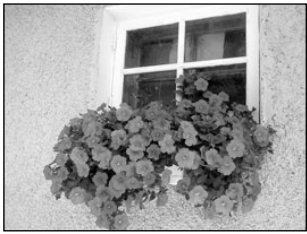
Rõdulilled ja amplid pakuvad vaheldusrikast lillepäeva. Lk 2