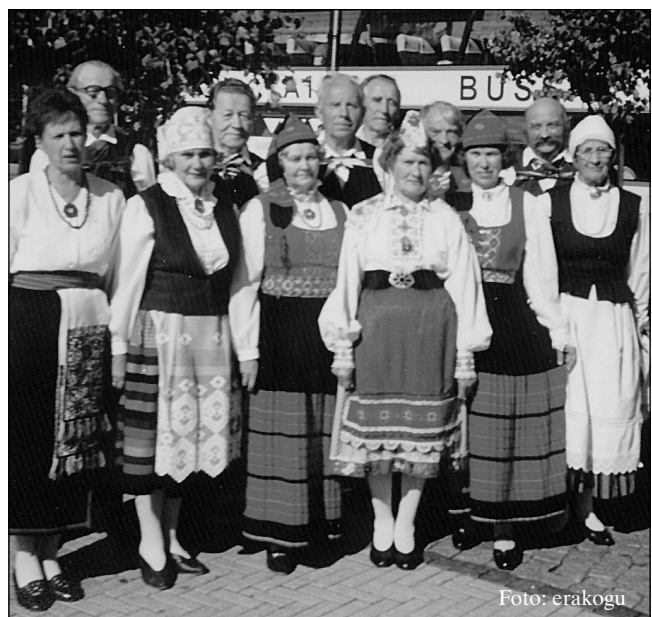
Tantsurühm Seniorid 2000. aastal Soome kontsertreisil.