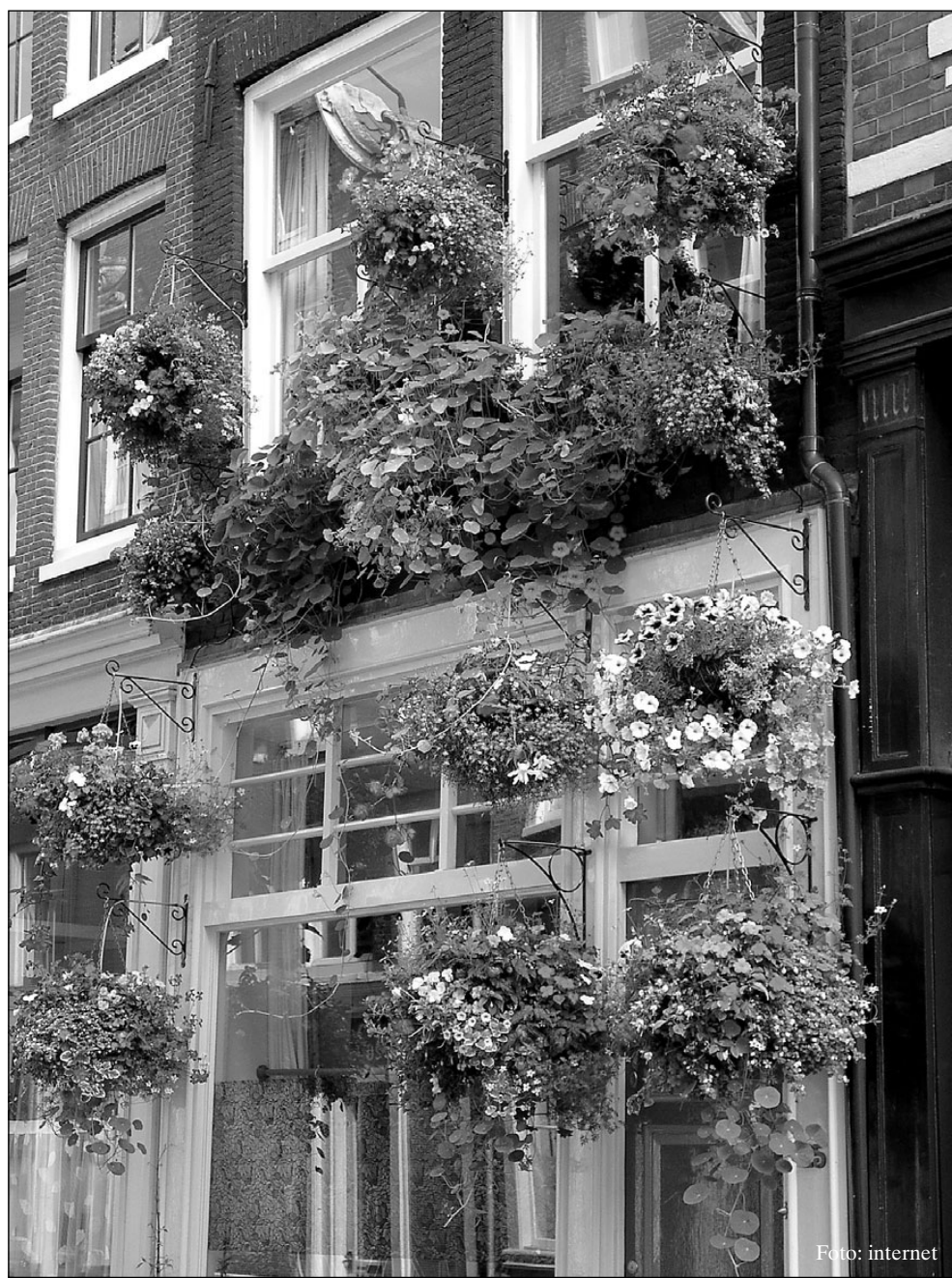
Tagasihoidlikule eestimaalasele harjumatu, kuid Euroopas üsna tavaline lillerohkus.

Petuuniad on üsna tundlikud rajuilmade suhtes. Oluliselt vihmakindlamad on minibetuniat sordid.