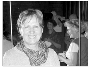
Seniorid kutsuvad sünnipäevakontserdile. Lk 4