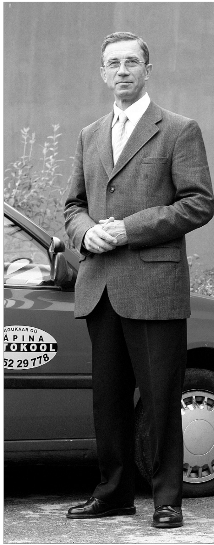
ÕPPEAUTO EES: peavanem peab Rāpinas autokooli, kus õpetab noori ohu-tult liikuma.

Omandiküsümis huunidõ ja maa as'oh om ka' ütš suur ja rassõ asi. Täämbätsel päävä lastas Vinnemaa haldusalase jäänü' huunõ' ja huunidõ ümb-re maa vormsta' eraomandiks perijilõ ja tuuperäst ma tahtnu' soovta', õt vormistagõ' huunõ' ja maa uma nimele, Vinne sää-düse' setä lupsõ'. Uma as'a iist piat saisma sirgõ säläga' ja ausahe, sis austas sinnu ka' tõõnõ puul. ■