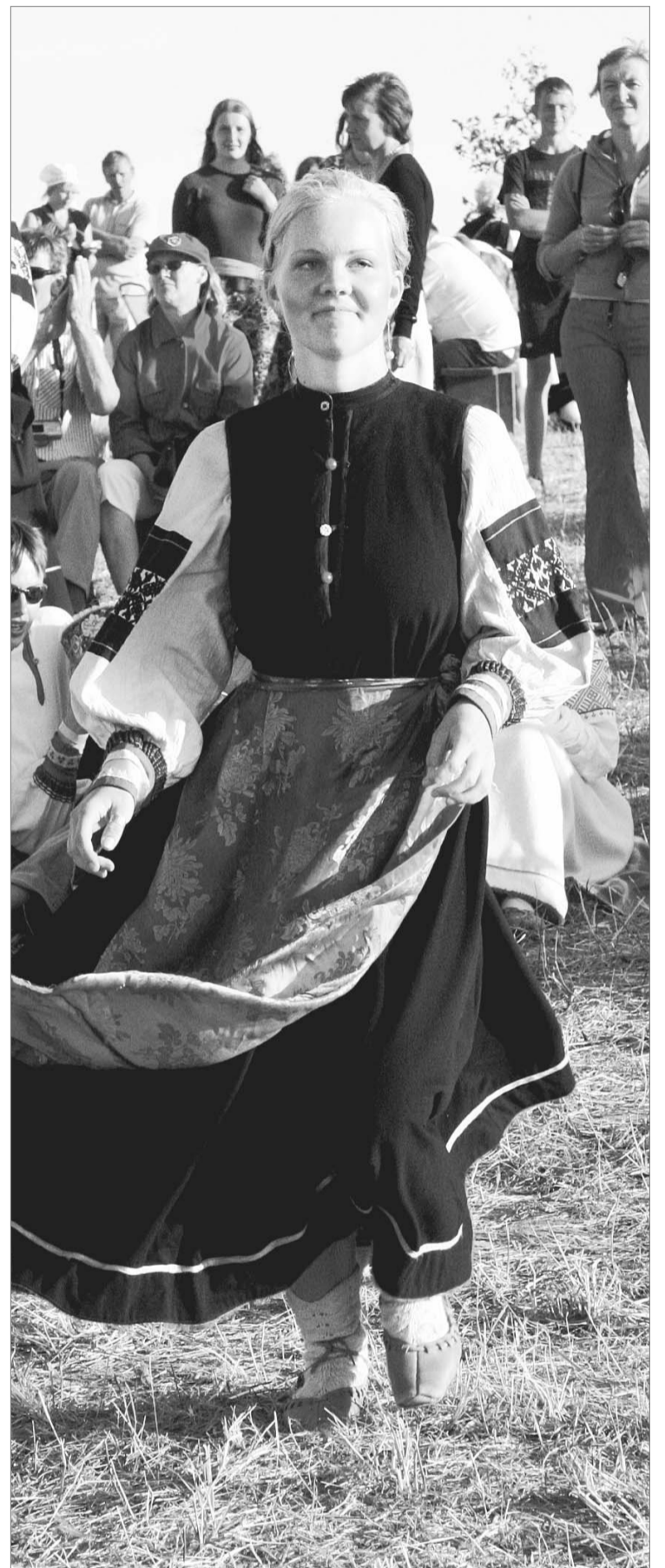
KARGUSÕ KARGAJA TÜTRIK: Kahuski Salmõ s'oo aasta Kuningriigih.

Ilosidõ ts'urri-ga' (Salmõ jalki' naard). Tuuperäst om s'oo nii, öt noorõ' hoitva' ja kandva' seto kul-tuuri edesi. Tõõnõkõrd om viil niimuudu, öt ts'ura' kõnõlõsõ' uma-vaihõl seto kiilt pall' o inäbä ku' tütrigu'. Mullõ paistus, öt ts'ura' häbendele-ei' nii pall' o setost olõ-mist ku' vahtõpääll tütrigu'. ■