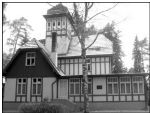
Elva väikelastekodust saab asenduskodu. Lk 2