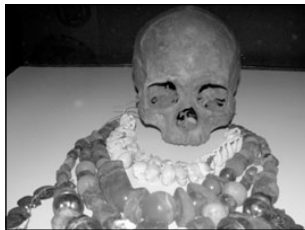
Tartumaa muuseumis avati korraga kolm näitust. Lk 3