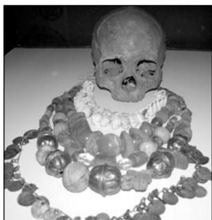
Noore naise kolju 16. sajandist pärit kaelaehetega näitusel "Teekond varjuderiiki".