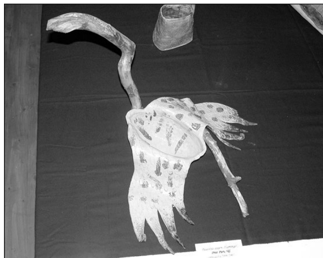
Õpilastööde tarbekunstinäituse üks pilkupüüdvatest taiestest - Priit Puru (6. klass) eelmisel õppeaastal valmistatud puuviljavaagen "Flamingo".

Anni Irsi maalinäituse kaksikümend üks orna-