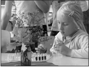
Riik eraldas pikapäeva-kooli projektidele startiraha. Lk 2