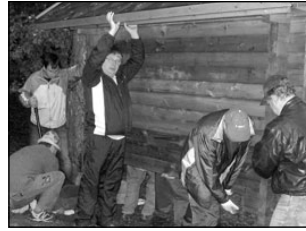
Elva "lövid" tegid Murumunas tööd. Lk 4