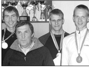
Laskesuusatajad linnapea vastuvõtul. Lk 3