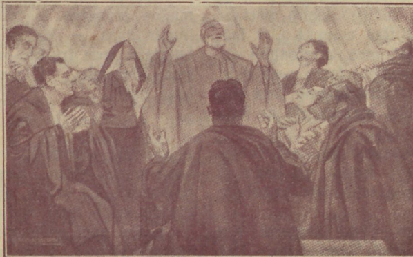
Püha Waimu wäljawalamine.

Need olid palwepäewad. Seal ei tulnud kokku armustama, taga rääkima, arutama päewa sündmust ja majandus-