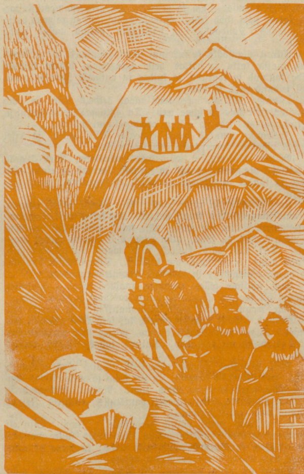
Küüsin rööwliitelt teed . . .

„Tee on seal!“ ütles pealik ja hakkas oma seltsilistega nõu pidama, kuidas meid rööwida. Üks rööwel küüsis: