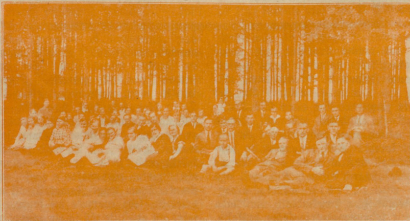
Wandsburgi ühing Waldeswiefeil.