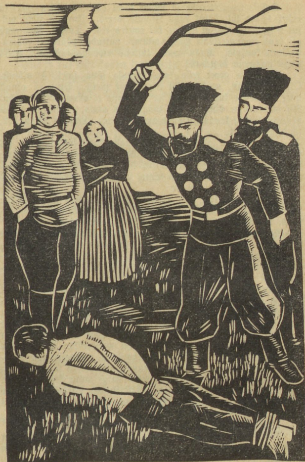
„Ja kõik said üksteise järgi 25 hoop! . . .“

Umber kakskilomeetrit meist elasid R. külas mõned usus tagasiäänitud wenelased riis ja tülis. Kuulsime seft ja ofustajime neid lepitama minna. Oli asi wendade wahel lahendatud, nad alandunud üksteise ees, jäime sinna ewangeliseerima. Oli talw, ja üks wendadest sõidutas meid omal reel külast külla. Läksime lauldes mõõda küllatänawat ja kutsusime koosolekule meid uudishimuga jälgiwaid noori ja wamu. Ühel õhtul tulime