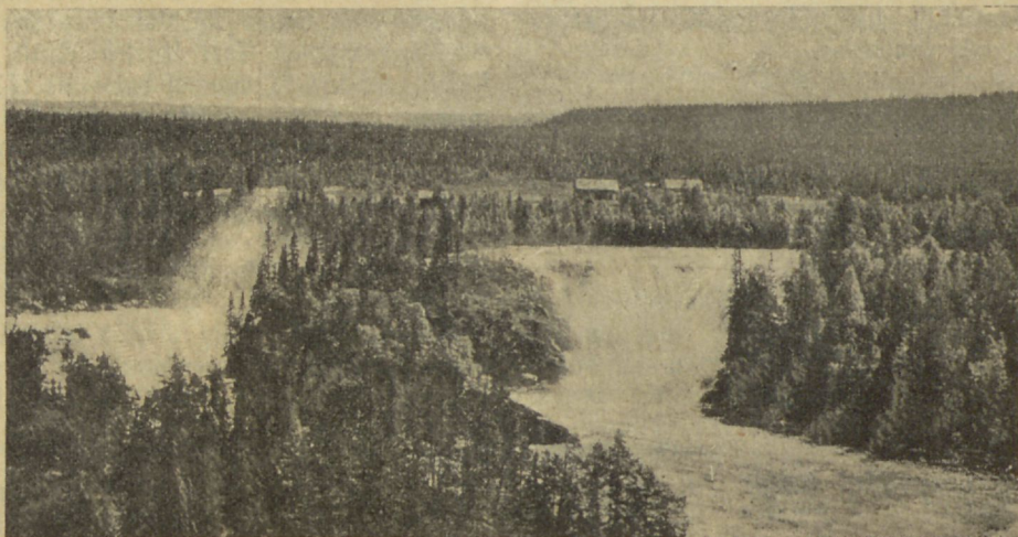
Üks suurepäraseid waateid Rootsi.