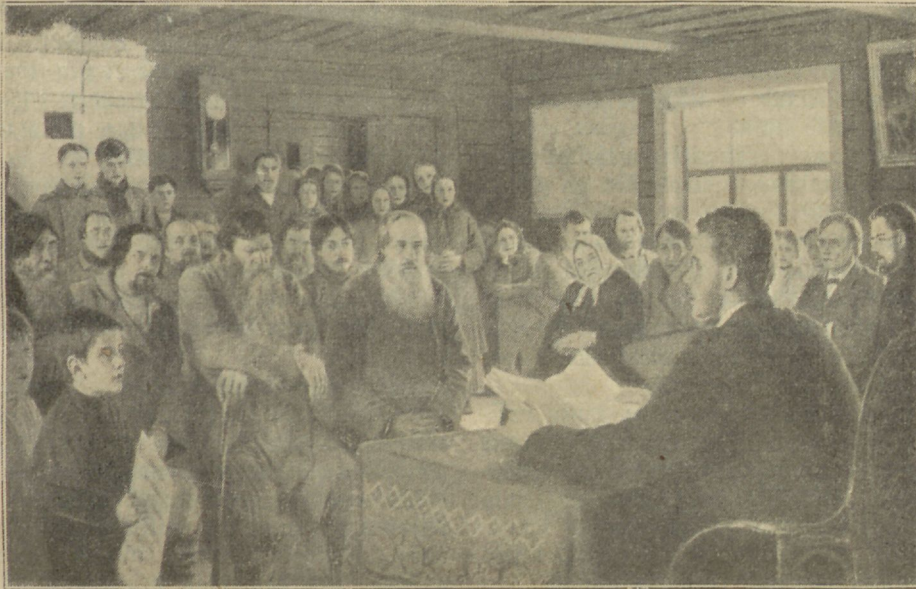
Jumalasõna lugemine Vene külas. — Bogdanov-Belsky maal.

Seal vastasin ma otsustavalt kirja andjale: „Inimesed kahetsevad, tunnistavad oma rikutud elu, pöörduvad Jumala poole, ja teie lubate vendile katkestada Jumala õnnistust! Kus ja kuidas mõt-