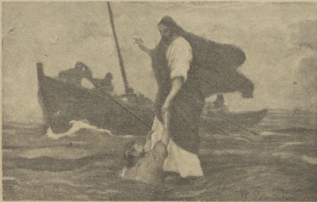
R. Leinweberi m. järele.

Rõige pealt Issand Jeesus. Ei ole ühtki muud nime taewa all, kelle läbi inimesed õndsaks saaksid. Ap t. 4: 12. Tema on wäärt meie usaldust omandama, sest Ta on ustaw. Paulus ütleb: kui ka meie ei usu, siiski jääb Tema ustawaks, Tema ei mõi iseennast ära salata. 2. Tim. 2: 13. Usalda Teda, kelle suust pole pettust leitud. Tema ei peta ka sind iialgi, sest Jeesus pole kedagi petnud, kuigi meie seda oleme teinud. Jeesus on ka tügew. Meie mõime täiesti usaldada Teda, sest Ta suudab meid aidata. Nõtru ja wäetid on Ta töötanud oma öla peal kanda. Kui kallid! Tunned ja end nõder — siis on Tema wägem. Meie tohime kõigis