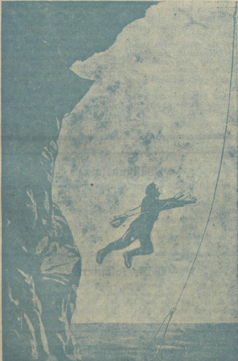
Süpe peastendõõri järel.