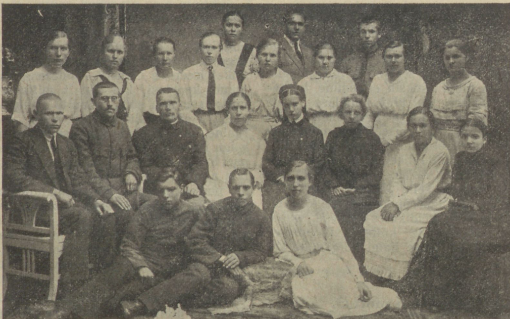
Bärnu C. E. noored.

ligi, ja katsu temasse piutuda (Luka 8:46). Sa saad näha, et tema wägi sinu nõdruses täie wõimuse saab. Pole sellest wiga, kui sind jõledaks ja rumalaks armu sandiks peetakse, armu läheb sulle just waja, sest see on sinu elu. (Mat. 5:6). Isand võib su elu õnnistusrifaks teha, kui sa temast wäge wõtad. Ka apostlid olid wäljastpoolt näha kui need, kelle käes midagi ei olnud, (2 Kor. 6:10), kuid kelle käes ometi terve Jumaliku elu täius oli Kristuse wäe läbi. (Ewes 1:19, 22, 23). Wiimane leige aeg tahab wägise usklikkude elu wälise kombete sisse wiia ja südamed Jeesuse armust tühjaks rööwida. Seepärast, kallid noored, wõtka wäge palwes Jeesuse seest. Opi Jeesuse elu tundma, mis kõik sinu puudused võib täita. Sa leiad temast küll: tõsidust, armastust, alandust, pikka meelt, kannatust, truudust, puhtust ja pühitsust. Kristus on kannatuse läbi täieliseks tehtud. Katsu sinagi tema kannatusest fedu wäge leida, et