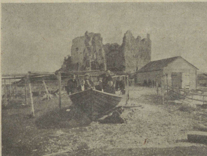
Toolse lossi waremed.

Kui palju, kui palju... Lõbus, täis elu, lustiline ja rõõmus laewapersonaal — üksainus