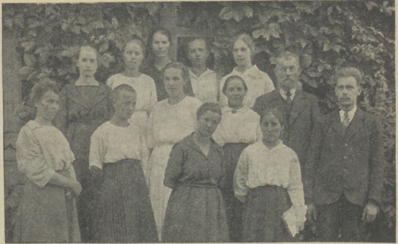
Paide noored Wõhmas.

2. juulil olime Karlowas, mis asub 3 wersta wene-piirist. Ilm oli wäga ilus ja rahwast oli ümbruskonnast,