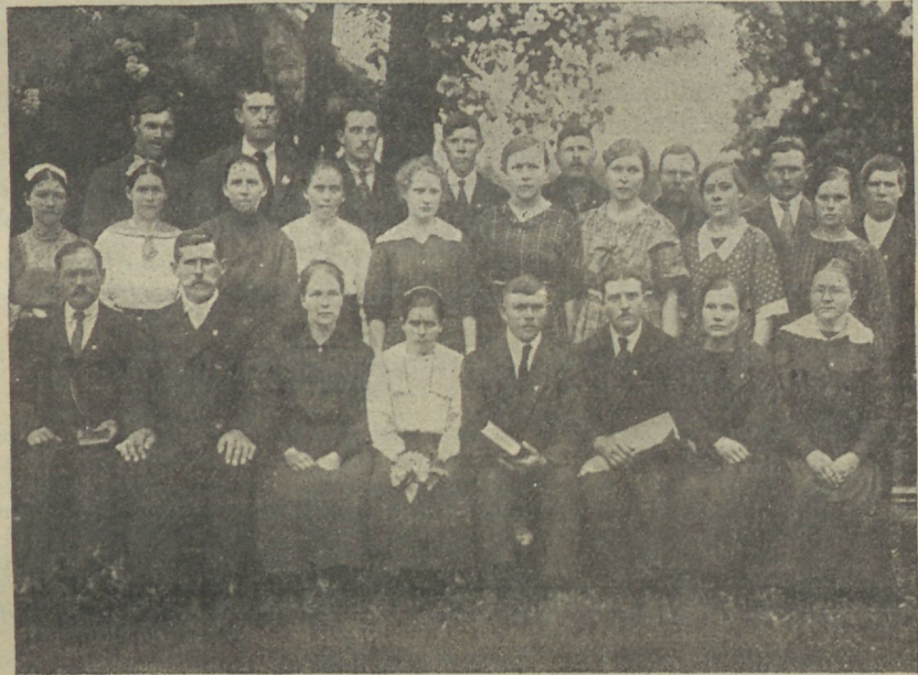
Wiimsi-Maardu C. E. Ühing.

„Sowronia!“ algas Kamilla, „kas teie jumalad