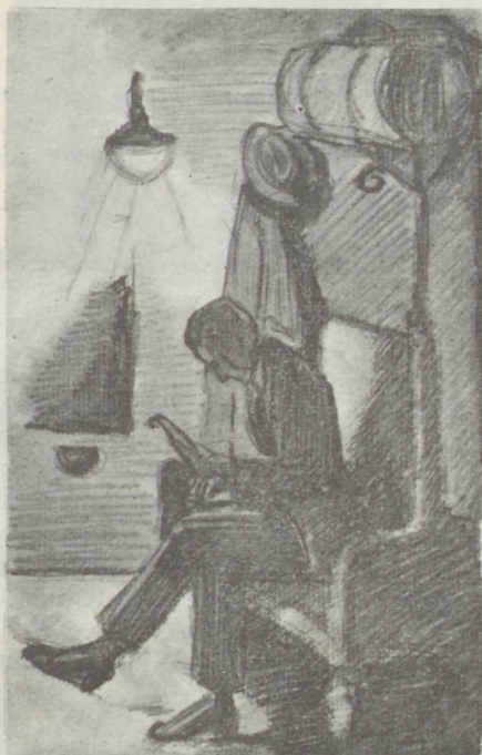
Jkka uuesti pidi ta lugema telegrammi.

Kui hästi oli ema ofanud talitseda wallatud poega, näidates talle teed edasi ja ülespoole, kõige kestwa ja wäsimatu armastufega, mis wõib olla ainult emal,