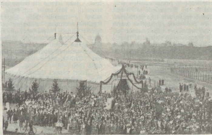
Saksa C. E. laste telk — wäljast.