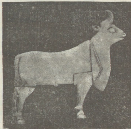
Härja kuu — leitud templi alusest Tel-et-Obeid'ist Ur'ist — Kaldeast.

„SIONI SÕBER“ kirjutab: Briti muuseumi Londonis rikastati tähenduswäärilise arheoloogilise muinaswara kogu poolest, mis Assüüria Ur linna