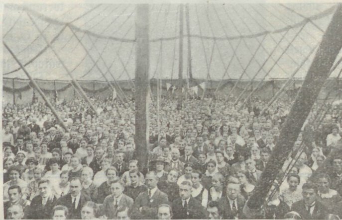
Saksa C. E. laste telk — seest.