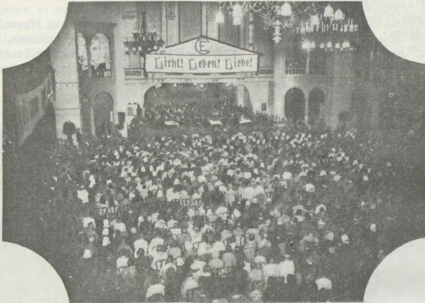
Saksa C. E. konverents.

Wägew armastuse side köitis meid ja P. Waimu rõõnnustamine oli meiega. Palju üllatust oli ka. Näiteks oli mul täiesti teadmata, et Prantsuse maal, primitiiv-metodistide seas terwelt 32 C. E. ühingut. Weel suurem oli meie imestus, kui kuulsim, et Hispaania kõik usklikud ringkonnad selle töö korralduse omaks on wõtnud ja seal praegu juba 58 ühingut olemas. Ka Läti ja Poola C. E. kiire kasv rõõmustab meid kõiki. Aruannetest oli näha, et pärast sõda pea igalpooluut C. E. töö tõuju märgata. Annan siinjuures statistilise ülewaate Euroopa kohta, mis on wälja wõetud raamatufest, mis ilmus selle konverentsi puhuks ja on ka liidu sekretäri juures meil saadawal: «Der Jugendbund für C. E. in Europa.»