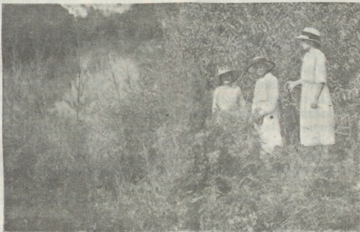
A. Liblik Jordani ääres.

Kas peaks nende naer, pilge ja loogikata õhusel segama teisi, kes on enese hinges läbi elanud õige wabaduse õiget ilu ja suurust?