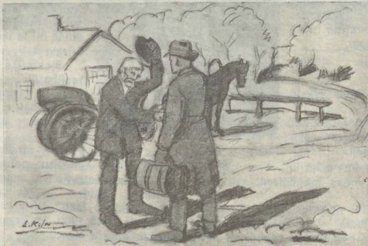
„Tere Laks! Kuidas on ema seisukord?“

Kuid nüüd magas ta seäl kodus, wõideldes surmaga.