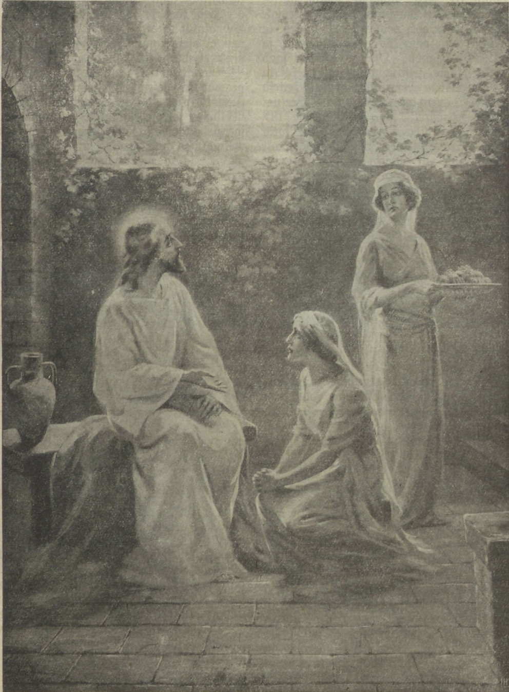
Jeesus Marta ja Maria juures.

oli mööda saatnud, leiame, et Ta sagedasti õhtutel Betaaniasse, wäikse alewi wäiksesse läks, (Mat. 21: 17; Mark. 11: 11) mis Jerusalemmast mitte kaugel ei olnud, waid kõigest wiisteistkümnend wagu, wõi umbes kaks ja pool wersta. (Joh. 11: 18) Seal elasid Maria ja Marta oma wenna Laatsarusega, kes tugewa sõpruse sidemega kõik Jeesusega ühte olid seotud. (Joh. 11: 3, 5, 11, 36). Jeesuse sennatulekul