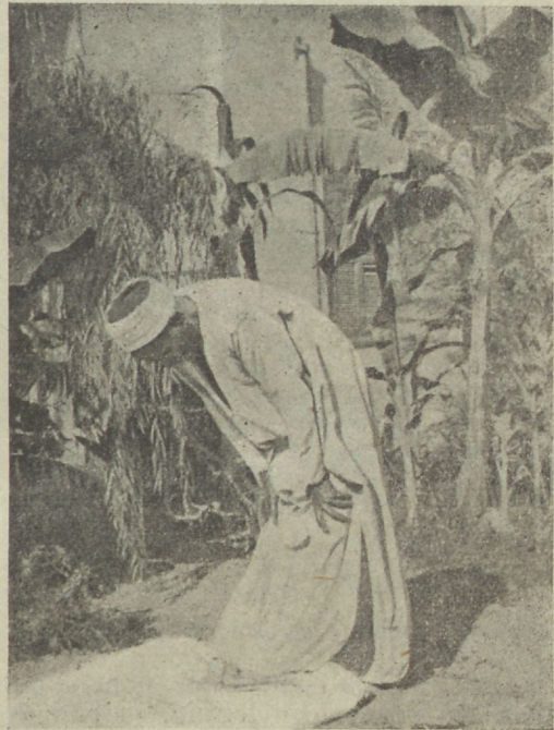
Mina kummardan sind, oma suure Issanda pühadust.

Seesugune alaline oma lühikese usutunnistuse kordamine on Islami usule suureks tugewuseks olnud, sest et iga harimata mees teda kergesti korrata wõis ja sellega ennast