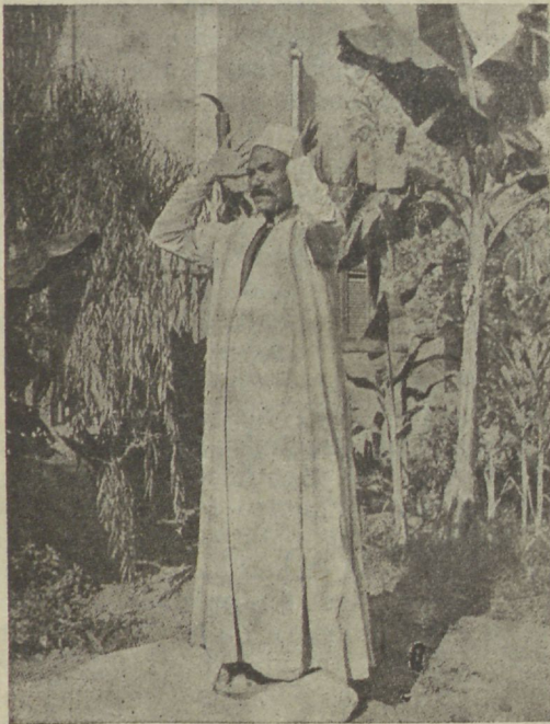
Jumal on suur.

Esimene samm on Jumala tunnistamine. Siin on see kõige lühem usutunnistus terwes ilmas ja ta on wist sagedamine, kui ükski teine korratud. Ta on nii lühikene, et kolmeteistkümne aastasaja jooksul ei ole tarwis olnud teda parandada ega õiendada. Sülelastele saab teda õpetatud ja surijate kõrwa sisse sosistud. Wiis korda päewas kõlab ta minarettide pealt terve Mohametlaste ilmas — „La-ilaha-illa-Allah, wa Mohamed Rasulu-Allah“. Mohamed olla ütelnud, et kes neid sõnu tunnistab, saab suure palga ja et see tunnistus niipalju maksab, kui sada head tegu, — ja et sada pattu saab temale andeks antud ja et tema saadana eest kaitstud saab. — Need sõnad on Islami sõja- ja wõiduhüie. Neid wõime