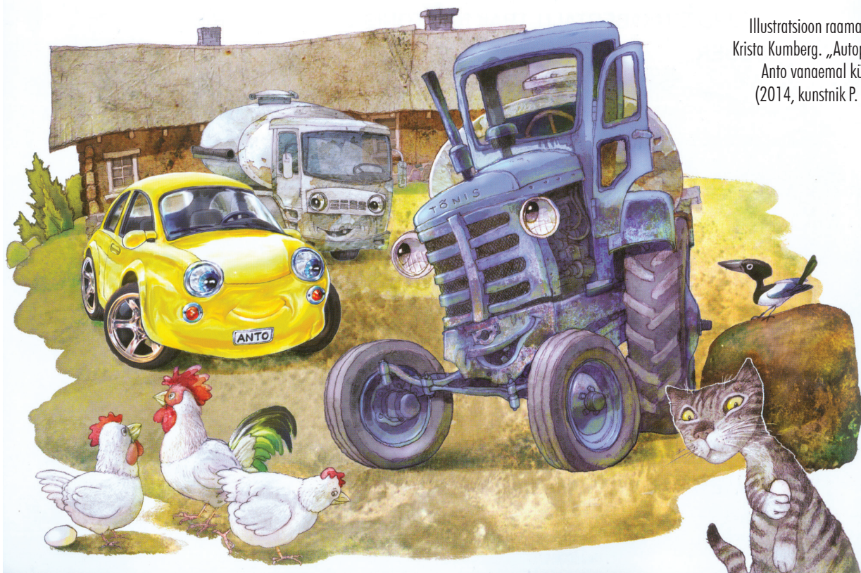
Illustratsioon raamatust: Krista Kumberg. „Autopõnn Anto vanaemal külas” (2014, kunstnik P. Rea)

keskkonda muuta. Tema üks vanem sugulane elab maal ja nõustub lapse enda juurde võtma. Tõepoolest – tüdruk saab terveks. On see siis tallekese võlutemp või sobiv keskkond, või kasvab oma hädadest välja, mine võta kinni.