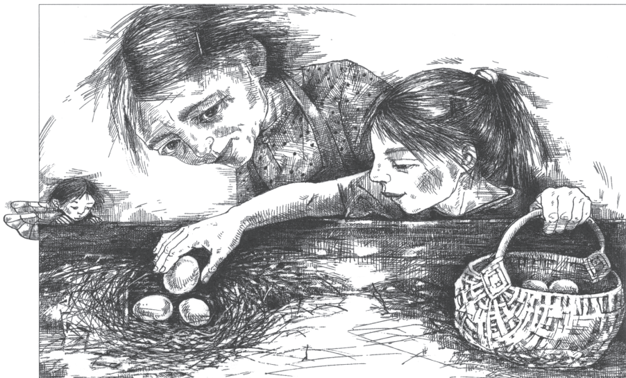
Illustratsioon raamatust: Kärt Hellerma. „Õrnad kõrvad“ (2010, kunstnik R. Saks)