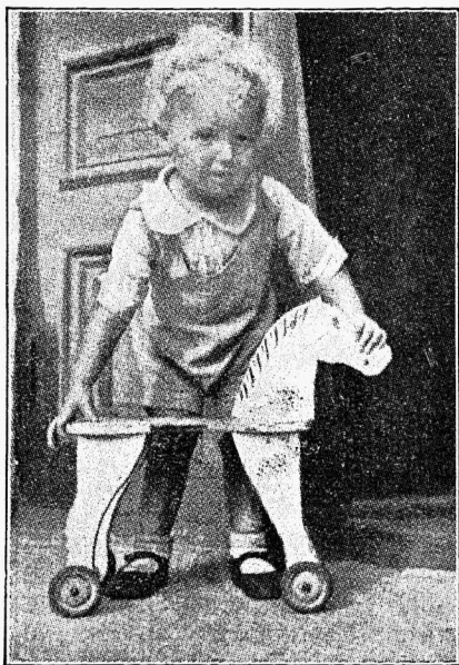
„Kui õige sõita ratsuga pühapäevakooli . . .“

Väinol oli nutt kurgus, kuna isa ei näinud kuulvatki, mida poeg ütles.