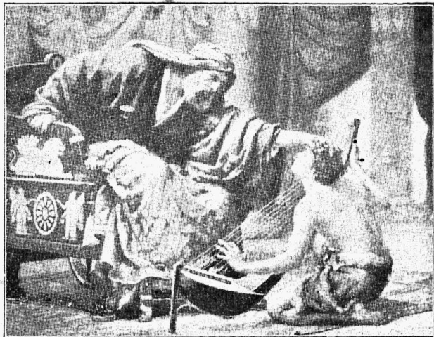
Kuningas Saul ja Taavet.

Saul oli tõstetud kuningaks. Ta pidi olema rahvale juhiks ja valitsejaks. Kallid lapsed, kas arvate, et kuningas võib teha kõik mis iial soovib oma tahtmise järele? Ei — isegi kuningas peab tegema Jumala tahtmise järele, peab olema Jumalale sõnakuulelik. Jumal on