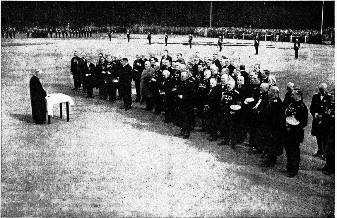
Läti Tuletõrje Liidu 10. a. juubeli-pidustused. Pidulik jumalateenistus Esplanaadil. 13. sept. 1931.

Tallinnas korraldati pidulik aktus Estonia kontsert-saalis, kuhu olid kogunud Eesti tuletõrje pere igast maanurgast