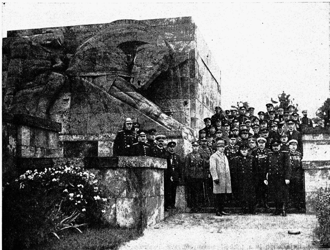
Läti Tuletõrje Liidu 10. a. juubeli-pidustused. Tuletõrje esindajad ja auvõõrad Metsa-surnuaial — Läti vabaduse sõjas langenute mälestussamba juures.

linna, pidurongis Düüna jõe kaldale, presidendi lossi lähedale, kus kõik auto ja mootorpritsid oma veeandmist demonstreerisid. Sellest üldisest veeandmisest võtsid osa ka sadama vabatahtlik tuletõrje oma tuletõrje aurikuga jõepeal ja raudtee tuletõrje oma veduriga ja tagavara veepaagiga raudteeliinil. Veeandmisega lõppes tuletõrje esinemine ja üksikud osad sammusid oma korteritesse muusika helide saatel.