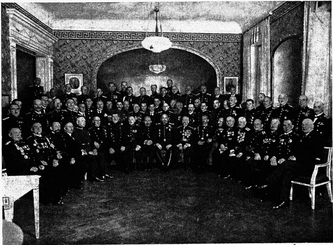
Läti Tuletõrje Liidu juubeli pidustused. Tutvunemise koosolek „Ressource“ saalis 12. sept. 1931 a.