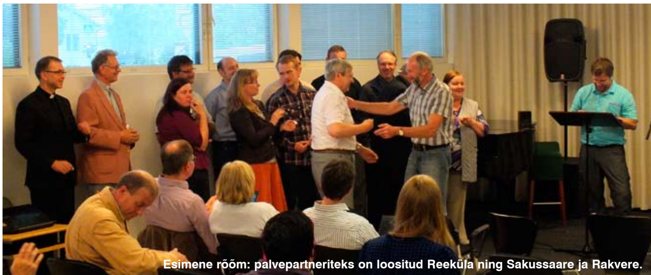
Esimene rööm: palvepartneriteks on loositud Reeküla ning Sakussaare ja Rakvere.