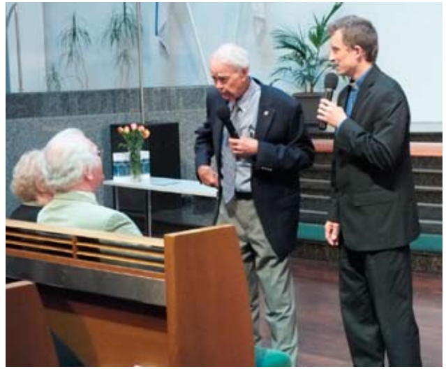
... ammine söbert Eddie Fox...