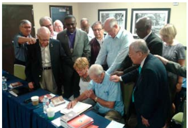
Palvehetk MMN-i evangelismikomitee piirkondlike sekretäride kohtumiselt.