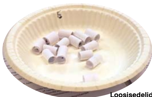
Loosisedelid on ootel.

EMK Tallinna vene kogudus – EMK Jõhvi kogudus EMK Keila kogudus – EMK Aseri kogudus EMK Tallinna Uue Alguse kogudus – EMK Sillamäe kogudus EMK Paldiski kogudus – EMK Kohtla-Järve kogudus EMK Jõhvi koguduse Helsingi tööpunkt – EMK Narva kogudus EMK Rakvere ja Sakussare kogudus – EMK Reeküla kogudus EMK Võru Elupuu kogudus – EMK Kuressaare kogudus EMK Tapa kogudus – EMK Pärnu Agape kogudus EMK Haapsalu kogudus – EMK Viitka kogudus EMK Kärsa kogudus – EMK Räpina kogudus EMK Paide kogudus – EMK Ruusmäe kogudus EMK Tallinna eesti kogudus – EMK Tartu Püha Luuka kogudus ja EMK Jõhvi Petlemma kogudus