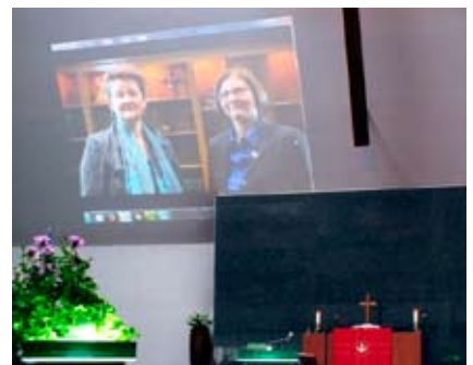
Päevasõna tegijad olid saatnud oma tervituse liikuva pildi vahendusel.