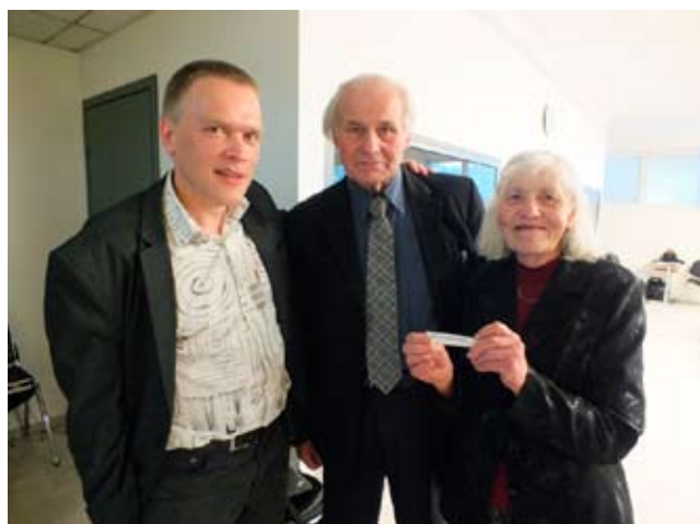
Palvepartnerid Võru Elupuu ja Kuressaare kogudusest.