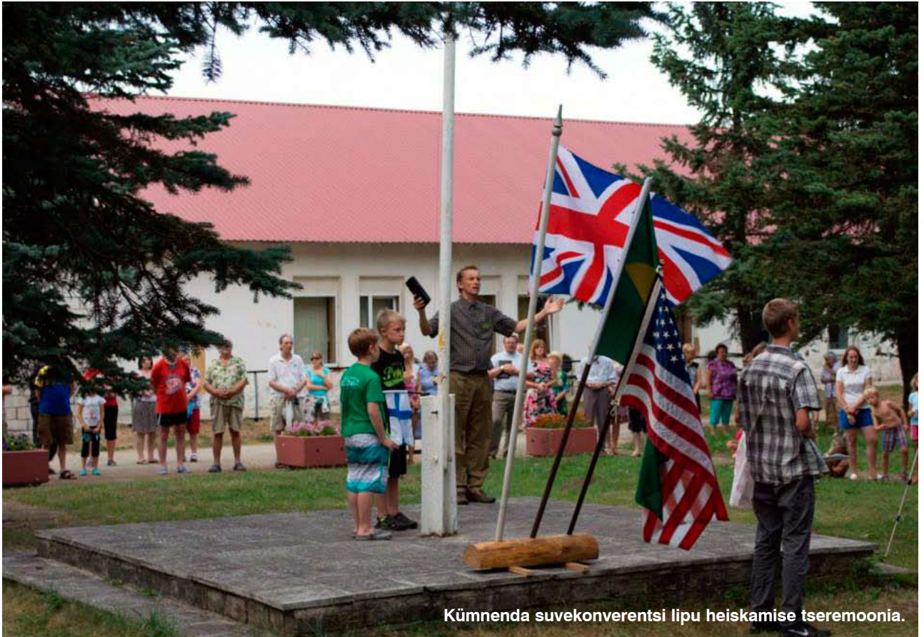
Kümnenda suvekonverentsi lipu heiskamise tseremoonia.