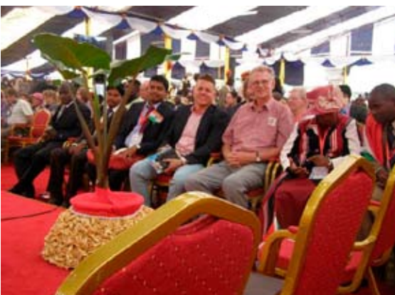
Pastorite konverentsil Keenias.

Keenias on praegu suur vaimulik ärkamine, sünnivad suured imed ja tunnustähed. 31. detsembril 2012 lan- ges Kisumu suurel äratuskoosolekul koguduse üle Jumala pilvesammas, millega kaasnes suur tervenduslaine. See oli tõeline Jumala au manifestat- sioon, sest kui prohvet kõndis ja kõne- les, liikus pilvesammas koos temaga. Seda võib igaüks ise jälgida veebile- hel www.repentandpreparetheway.org , lisainfot pakub soomekeelne