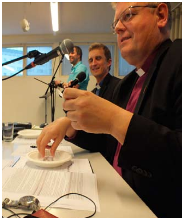
Piiskop valimisi läbi viimas.