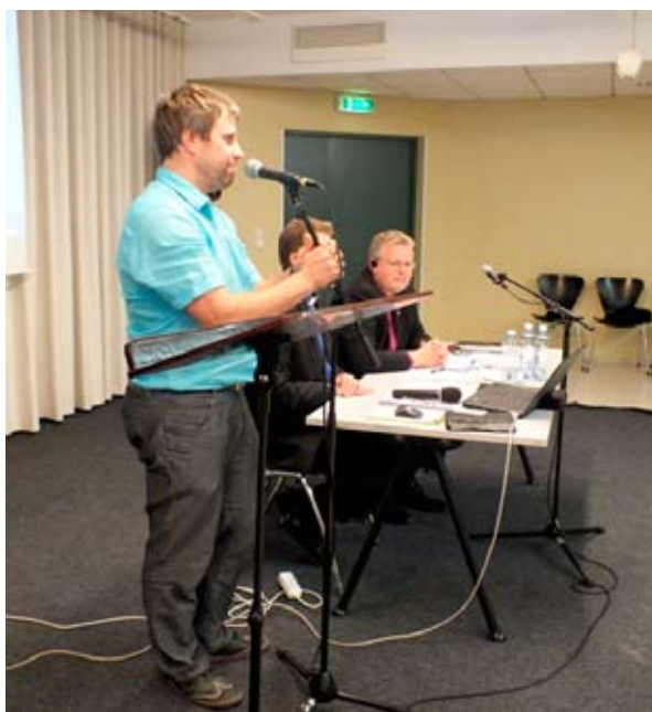
Urmas Sassian palvepartnerlusprojekti tutvustamas.

Aastakonverentsil sai iga EMK kogudus esimest korda ajaloos endale palvepartnerkoguduse.