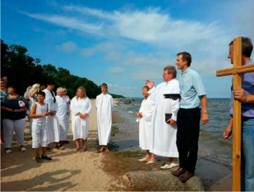
Ristimistalitus Aa rannas.