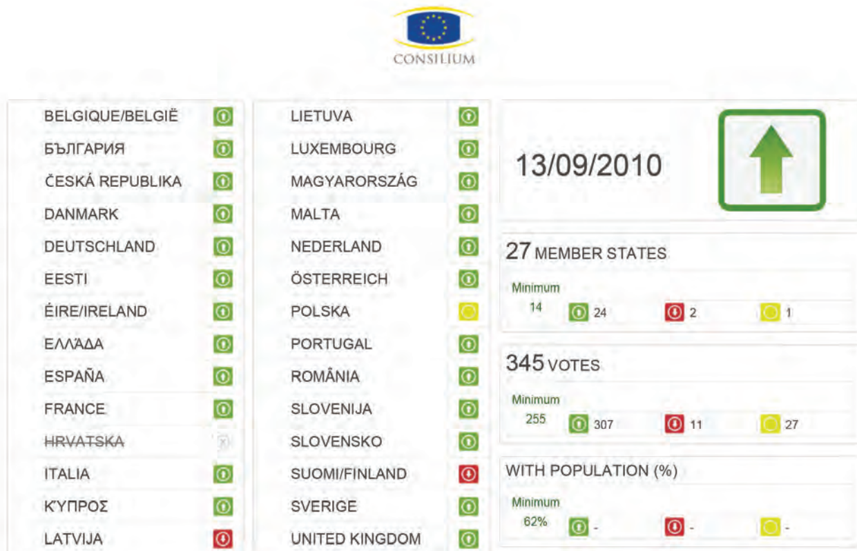
Joonis 2. Hääletustulemused

Nõukogule avaliku arutelu päevakorrapunkti all esitatud dokumendid ja seadusandlike aktide vastuvõtmise hääletustulemused on avalikud. Nõukogu veebiülekannete leheküljel sisaldab linke arutatavatele või vastuvõetavatele dokumentidele ning pilti seonduvast hääletusest.