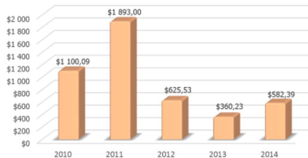
Joonis 1. VF import Süüriasse

mlrd USD jagu Süüria võlgu (hinnangulisel 70% ehk 13,6 mlrd USD tasemelt 3,6 mlrd USD tasemele 15 )