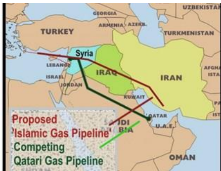
Joonis 2. Võimalikud Süüriat läbivad gaasijuhtmed.