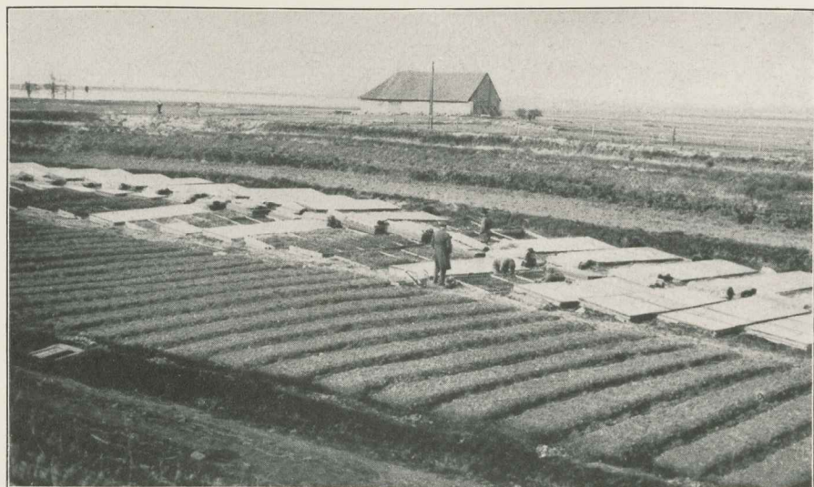
Lavad Kopli töö- majas.