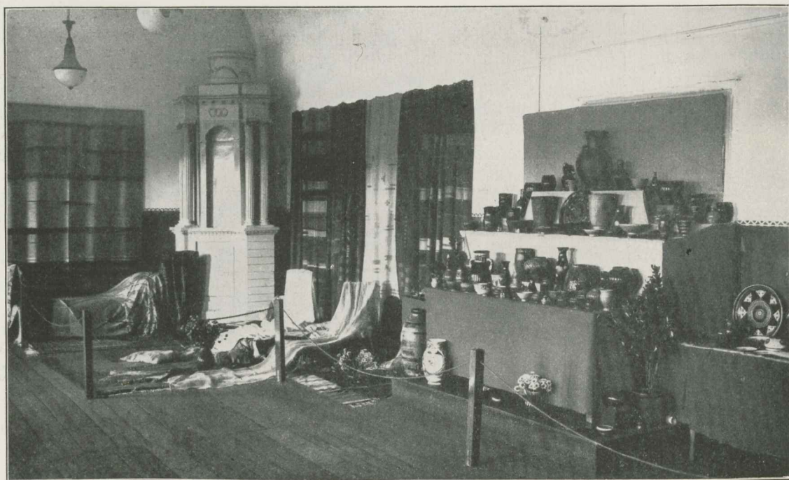
Tartu Naisühingu õpilastööde näitus 1934. a. kevadel. — Osaline kogu töödest keraamika ja kudumise alal.