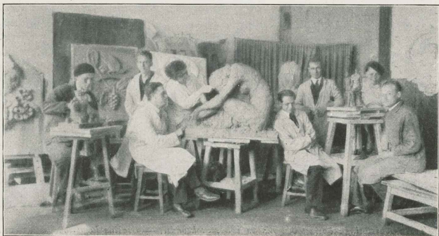
Rüigi Kunsttööstus- kooli keraamikaosa- konna õpilasi õppe- tööl kooli töökojas.