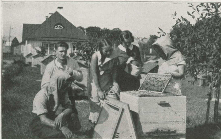
Tallinna Pedagoogi- giumi üldharu õpi- lased mesinduse praktilal.