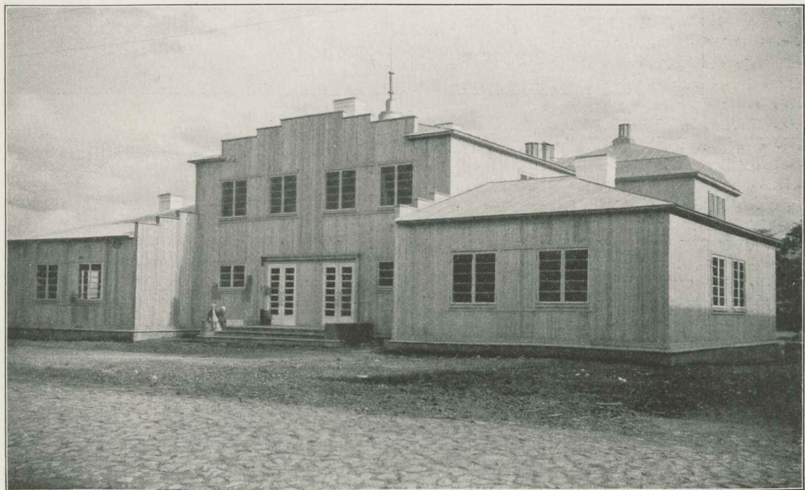
Võhma rahvamaja Viljandimaal, avatud 1934. a.