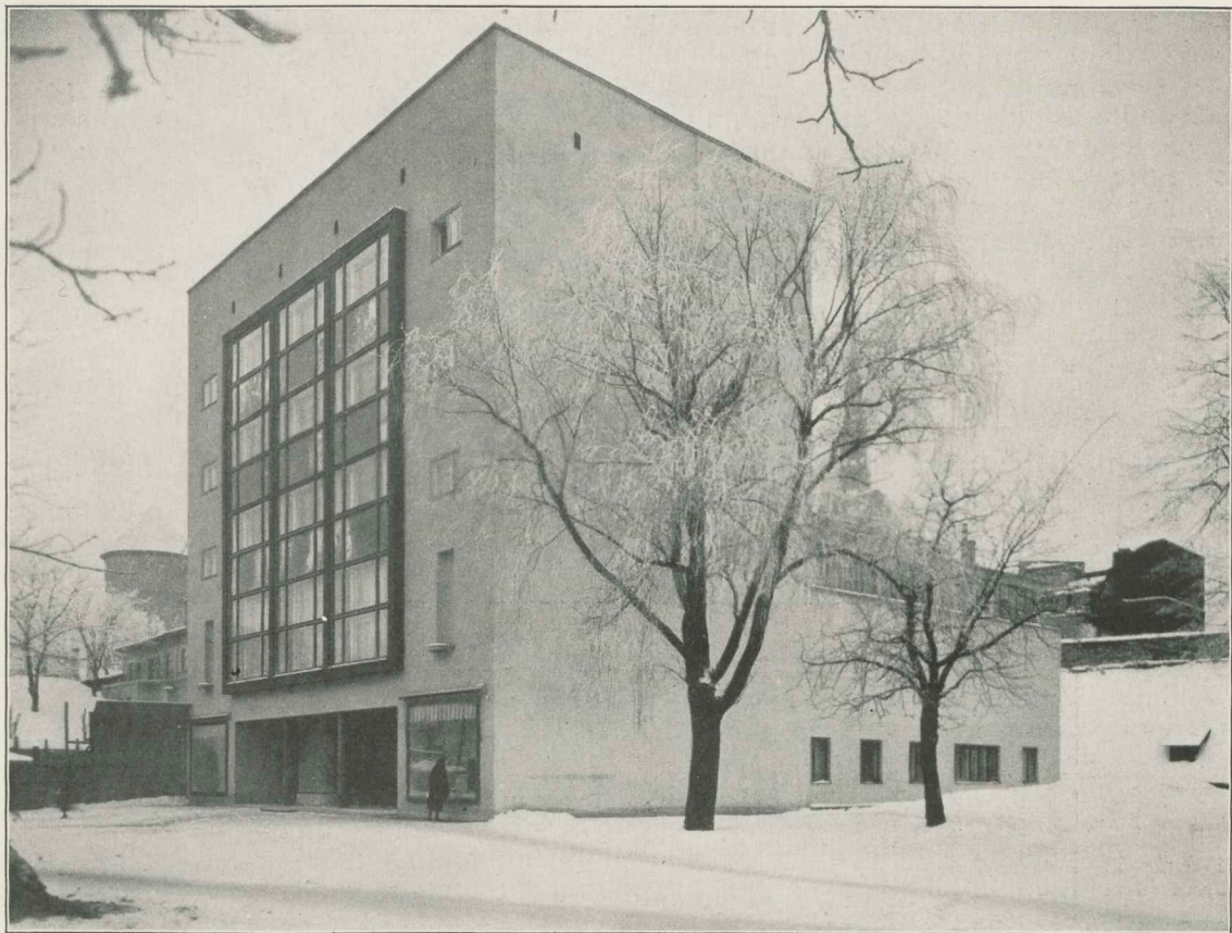
Kunstihoone Tallinnas, avatud 1934. a.