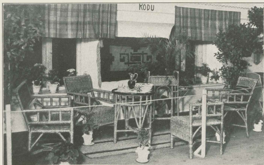
Rõdumööbel, val- mistatud õpilaste poolt pimedate asutistes.