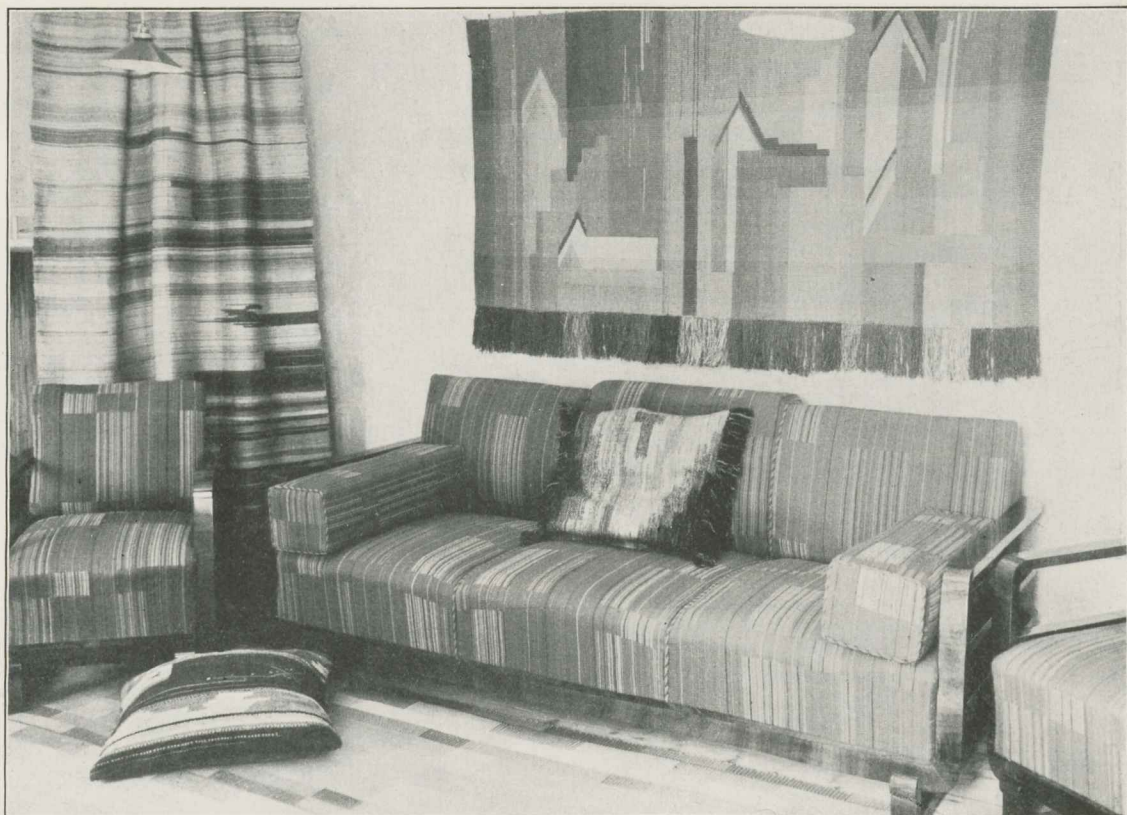
Tallinna Linna Naiskutsekooli õpilastööde näitus 1934. a. kevadel. — Osaline kogu kudumistöödest.