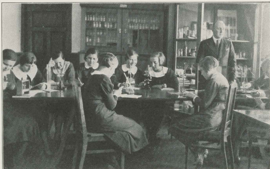
Pärnumaa Kaubanduskooli õpi- lasi kaubateaduse praktilistel töödel.