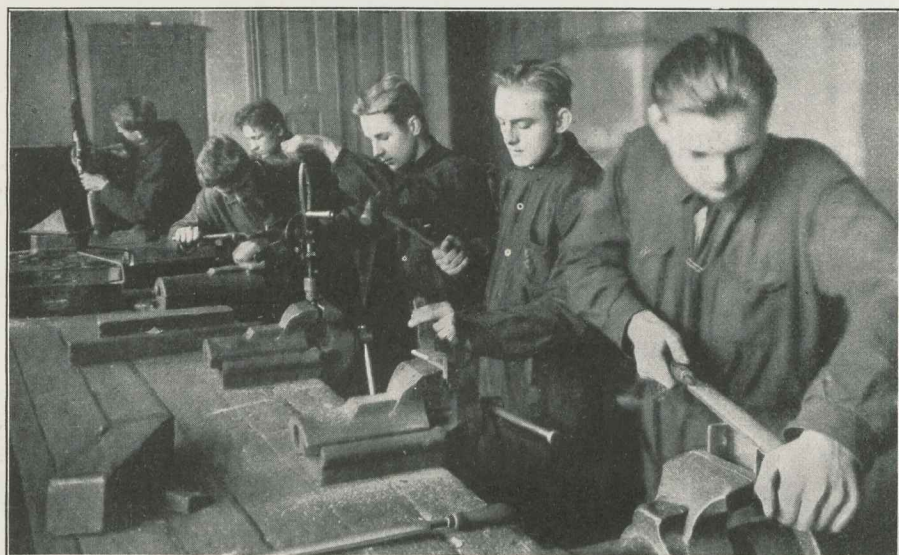
Rüigi Tööstuskooli metalliosakonna õpilasi tööl õppe- töökojas.