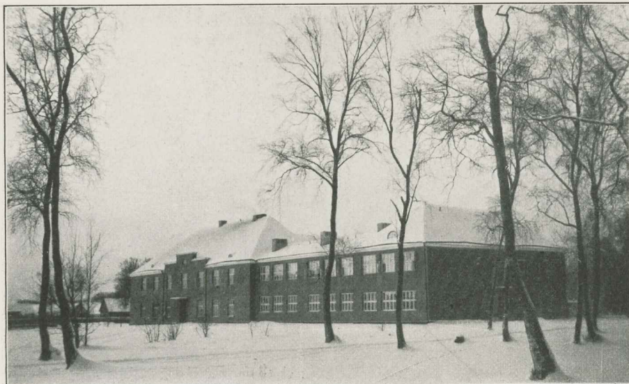
Kunda algkooli maja, avatud 1934. a.