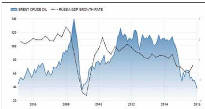
Brenti alushinna võrdlus Venemaa SKP kasvuga.