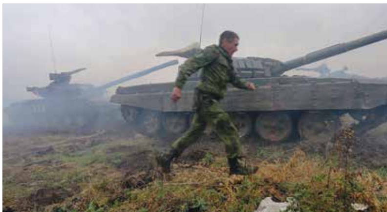
Separatist Donetski lahingutegevuses

Venemaa ei saa olla veenev regionaalne jõud ilma kontrollita Ukraina üle. Seetõttu oli Ukraina pööre läände pärast president