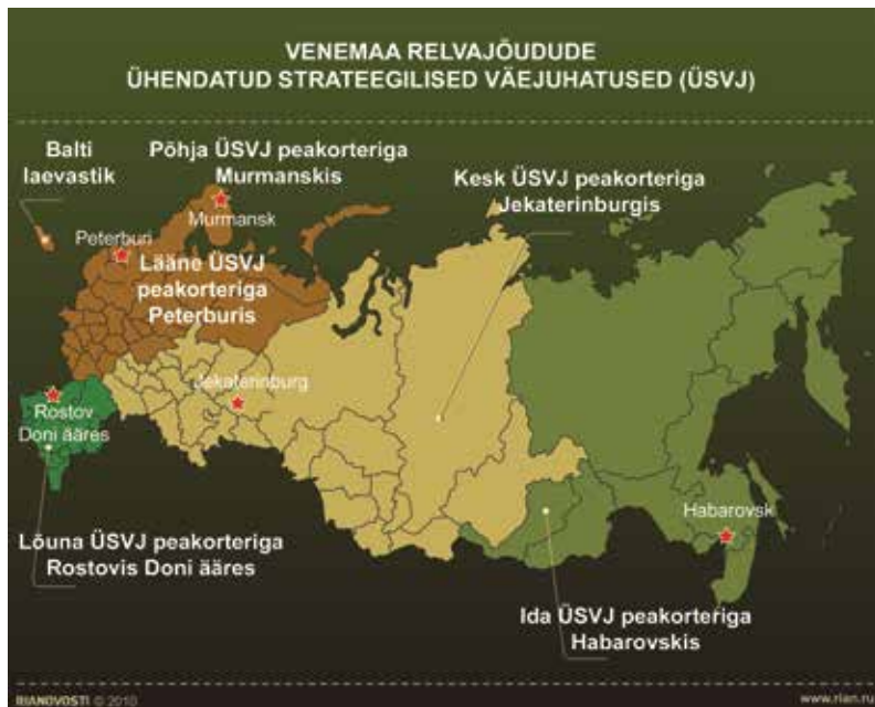
Venemaa ringkondade jaotused.